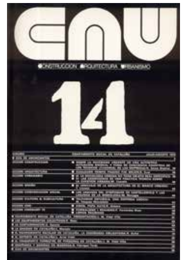
Fig. 3. CAU Construcción Arquitectura Urbanismo #14. Index, July-August 1972.