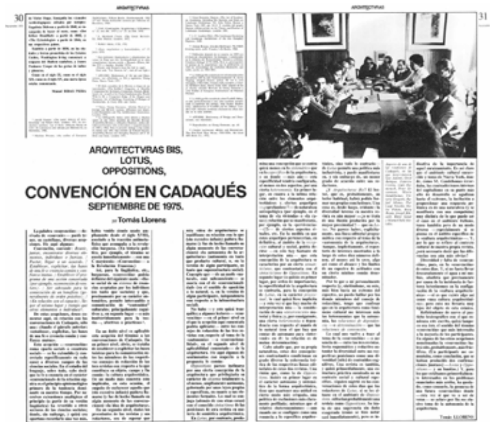
Fig. 1. Arquitecturas Bis #10, pages 30-31, November, 1975.

Although these three publications differed in some specific assumptions –formats and in the way contents were displayed– they all consciously contributed to consolidate a break with the traditions of modernism, as we can appreciate, for example, on the ‘After Modern Architecture’ Arquitecturas Bis ’ monographic issue, published in May 1978, (8) with original texts by Rafael Moneo, (9) Oriol Bohigas (10) or Helio Piñón,