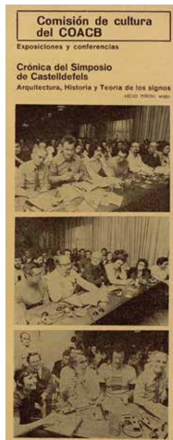
Fig. 8. Piñón, Helio: ‘Crónica del Simposio de Castelldefels’, Cuadernos de Arquitectura y Urbanismo , n.87 (1972), p.105.

This inquiry into the roots of modern ideology is present in Llorens, as it was in most of the editors of Arquitecturas Bis , who contributed to understanding publication as a medium, thus magazines and periodicals as laboratories for architectural ideas, aiming always to address what architecture can and should be, arising, as in the case of Llorens, discussions regarding, for example, architecture as a disciplinary autonomy, historical processes or the meaning in architecture; bearing in mind at all times that, as he put it, a magazine is also, and perhaps primarily, a practical –and theoretical– structure firmly rooted in a social and cultural specific context. (32)