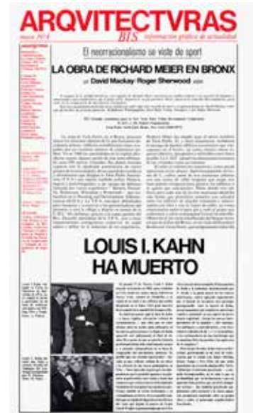
Fig. 2. Arquitecturas Bis #1. Cover, May 1974.

resulta todavía más plausible, con un diseño gráfico y formato radical (6) similar al de un periódico, capaz de generar un sistema gráfico propio que permitía desplegar los contenidos con cierta dinámica, atendiendo a tamaños de texto y de imagen variados y otorgando mayor importancia a algunas cuestiones que a otras. Lotus y Oppositions no fueron tan radicales en su formato como la revista española, independientemente del cuidado diseño y formato cuadrado muy reconocible de 26 por 26 centímetros en el caso de Lotus International , o en la imagen desarrollada por Massimo Vignelli para Oppositions . El valor diferencial de Arquitecturas Bis estaba, sin duda, en la manera de desplegar los contenidos, lo que resaltaba también un elemento de espontaneidad que Oppositions o Lotus nunca tuvieron. (7)