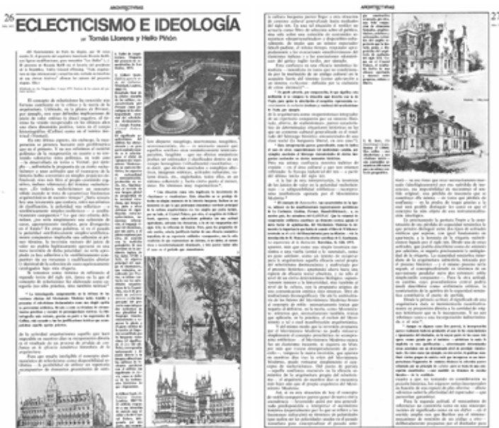
Fig. 7. 'Eclecticismo e Ideología', Arquitecturas Bis #8. Pages 26-27, July 1975.

rens' and Piñón's text begins with a newspaper quote that announced that another design by Bofill had proved to be an award winner in the international competition organized by the City Hall of Paris in order to renovate Las Halles urban area in Paris. The quote is at the same time a seemingly radical statement made by the award-winning architects to the newspaper, in order to explain their acclaimed and controversial design: "All architecture of international type has been excluded for the benefit of an historic synthesis". This reference to a current architectural affair was just an excuse to address the topic the authors were interested in, which was no other than the concept of 'eclecticism' and the way in which it had played a paradoxical and volatile role within the