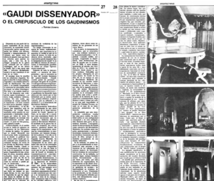
Fig. 6. ‘ Gaudi dissenyador ’ o el crepúsculo de los gaudinismos, Arquitecturas Bis #19. Pages 27-28, November 1977.

‘ Eclecticismo e Ideología ’ (‘Eclecticism and Ideology’) (23) was co-authored by Tomás Llorens and Helio Piñón (1942) (24), and originally published in Arquitecturas Bis n. 8 (July 1975) (Fig. 7). It is no coincidence that the essay was published together with at the time recently completed Ricardo Bofill’s (1939) Taller de Arquitectura residential building Walden 7, built in the outskirts of Barcelona. (25) In fact, Llo-