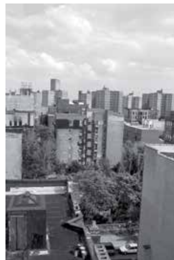
Fig. 1. Fotografía de un jardín de Loisaida. PASQUALY, Michela. Loisaida. NYC Community Gardens . Milán: A&Mbookstore, 2006

Margen, efecto dominó y nuevos modelos urbanos en los solares vacíos de Loisaida. Según Giorgio Agamben, para alcanzar cualquier innovación son necesarios pequeñísimos desplazamientos encadenados que no atañen al “estado de las cosas, sino a su sentido y a sus límites”, es decir, se sitúan en los márgenes. En 1973, tal desplazamiento marginal ocurrió en el sudeste de Manhattan, una zona empobrecida por la crisis financiera, repleta de edificios derruidos y solares sin interés inmobiliario. (1) El grupo Peace-Corps-Types lanzó botes con semillas en uno de los solares abandonados. Esta acción originaría el primer jardín comunitario de Nueva York. (2) (Fig. 1) La acción de toma vecinal de un solar público o privado se replicaría hasta constituir una amplia red. Su foco se situó en el cercano barrio de Loisaida (3) y el compromiso e iniciativa de su comunidad de vecinos, de origen mayormente portorriqueño, (4) constituyó un imprescindible motor urbano. Esta comunidad influyó en la consolidación y vivencia colectiva de los espacios urbanos, muy arraigada con la cultura portorriqueña. En el barrio, el grupo de trabajo vecinal Charas, (5) del que Syeus Mottel escribe un libro en 1973, llevaba trabajando en la recuperación de los espacios abandonados del barrio desde 1965.