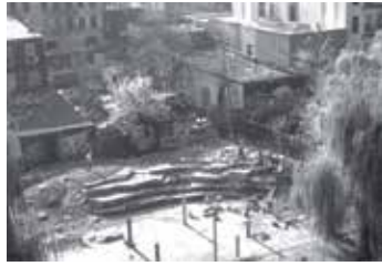
Fig. 4. La Plaza Cultural en los años setenta. HOLMES, Christina. Home at La Plaza , 2015. (Documental).