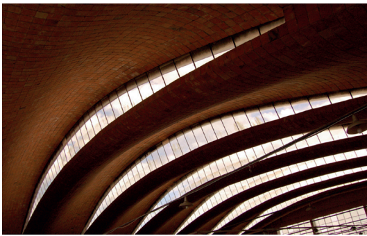
Fig. 11. Dieste, Eladio. Depósito Julio Herrera y Obes, Montevideo, Uruguay, 1979.