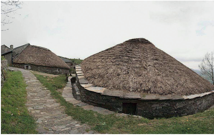
Fig. 4. Pallozas gallegas en O Cebreiro.