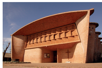
Fig. 12. Dieste, Eladio. Iglesia de Cristo Obrero, Atlántida, Uruguay. 1954-60.

contained in the trough of the wave; Dieste does not want it to stay visible in a church. It can be understood then that it is here that this constructive type invented and developed by Dieste reaches its maximum significant capacity and its maximum aesthetic value. Dieste's commitment is also maximal, with the Catholic faith he adopted as an adult himself, with the local population and with the workers (who in many cases coincided), and with the economy and sustainability of the work.