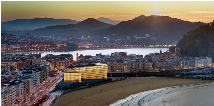
Fig. 3. Moneo, Rafael. Kursaal de San Sebastián, 1990-1999.

En efecto, parece ser que la teoría tipológica propende a la arquitectura genérica. Si el tipo es un concepto que describe una estructura formal, todos