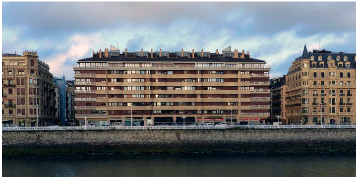
Fig. 2. Moneo, Rafael. Edificio Urumea. San Sebastián, 1968-1973.

following Luigi Pareyson’s reasoning. Of course, it is necessary to qualify this polarity, it is not a question of watertight categories, but rather, of an interpretive mechanism. It is necessary to assume the existence of a progressive grading between these extremes; this is how Pareyson himself proposes and this is required by the antidogmatic foundations of hermeneutical philosophy.