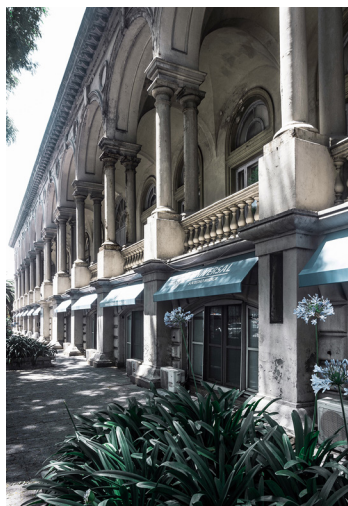
Fig. 6. Casas estándar en la ciudad de Montevideo, Uruguay. Fig. 7. Andreoni, Luigi. Hospital Italiano, Montevideo, Uruguay, 1890.

is the occupant who takes possession of that universal space and makes it his own". (15) But Torres Blancas (1961- 68) is a work of particular and 'specific' architecture. (Fig. 8) Possibly, the best way to understand Torres Blancas is as the commission of a 'work of art'; Sáenz de Oíza was seen as the 'artist' by his patron Juan Huarte. (16) "The uniqueness of the commission of Torres Blancas was that it had no economic conditioning whatsoever. It was a free commission, in search of a solution to a building in a residential tower block". (17) Thus, we have before us the finding that a building, just because it is a collective dwelling, does not necessarily represent the 'generic' condition of architecture.