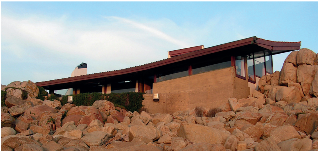
Fig. 9. Siza, Álvaro. Café Boa Nova. Matosinhos, Portugal, 1956.

El sistema constructivo de Dieste tiene múltiples aplicaciones posibles. Es concebido, precisamente, como una solución ‘genérica’ para la edificación de grandes naves con destinos industriales –Fábrica TEM, Montevideo, 1962–; mercados –Mercado de Porto Alegre, Brasil, 1972–; gimnasios –Gimnasio del Polideportivo de Durazno, 1974 (Fig. 10) y gimnasio del colegio Don Bosco, Montevideo, 1975–; almacenes –Almacén de distribución de cítricos