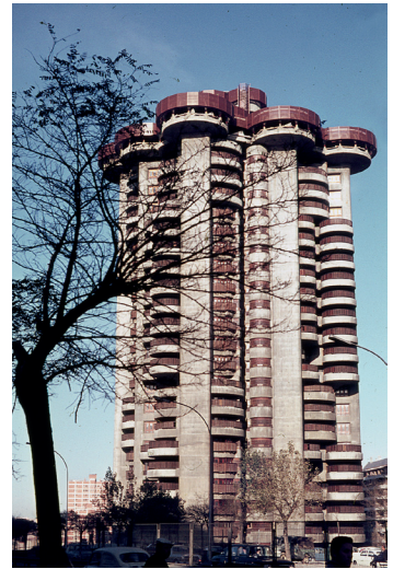
Fig. 8. Sáenz de Oíza, Francisco Javier. Torres Blancas. Madrid, 1961-68.

La teoría del 'lugar', con mayor seguridad, remite a una forma de hacer arquitectura que pone en evidencia la condición 'específica' de cada obra. El concepto de genius loci , trabajado teóricamente por Christian Norberg-Schulz, resulta un ejemplo emblemático. El conjunto de la obra de Álvaro Siza enseña cómo la arquitectura puede ser el resultado de un pensamiento que busca comprender e interpretar las características propias del lugar de emplazamiento. Esto es apreciable de forma paradigmática en un par de obras también cercanas entre sí: las Piscinas de Leça da Palmeira (1966) y el Café Boa Nova (1956) (Fig. 9) donde aún está marcada la presencia del maestro Fernando Távora. (18) Sin