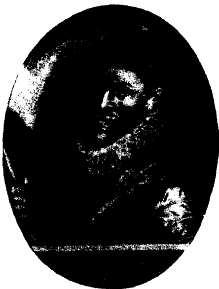
El gran marino, constructor y organizador inglés Hawkins, quien compartió el mando de la desgraciada expedición con Drake.

Algo de gran estilo debía de intentarse a fin de salir de aquel impasse que estaba agotando las no muy crecidas fuerzas de la monarquía de Isabel I. Un siempre inquieto Drake, y más desde su relegamiento a un cargo oscuro en tierra, propuso a la reina una nueva expedición contra el Caribe, con el objetivo, nada menos y aparte de los habituales saqueos, de establecer una colonia inglesa en el istmo de Panamá, base desde la cual se pondría en peligro todo el dominio español sobre el área. La reina accedió, pero desconfiando, por la dura experiencia de la capacidad de Drake para el mando de grandes y complejas expediciones, puso como condición que compartiera el mando con John Hawkins, reputado como navegante y