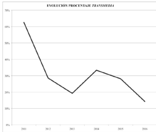
Gráfica 2. Evolución porcentaje campañas transmedia (2011-2016)