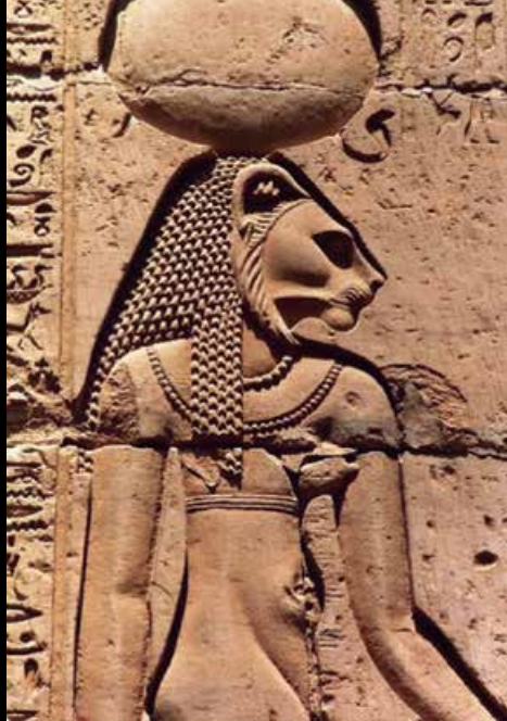
Isis y Sekhmet, diosas a las que los antiguos egipcios (y otras culturas vecinas) confiaban en gran medida su salud física