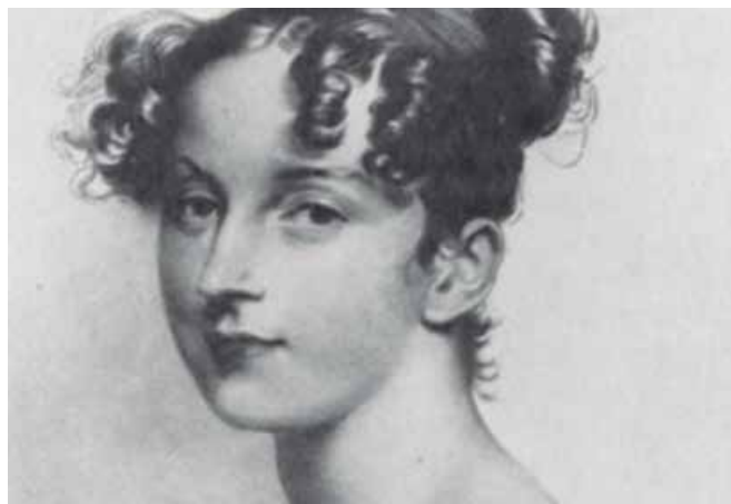
Retrato de la alemana Dorothea Erxleben, primera mujer en obtener un doctorado en Medicina

Otras mujeres sin duda participaron activamente en alguna modalidad terapéutica durante las primeras centurias de la Edad Contemporánea, aunque fuese “a la sombra” de reputados científicos, médicos o terapeutas del momento. Tal es el caso de la esposa del gran quí-