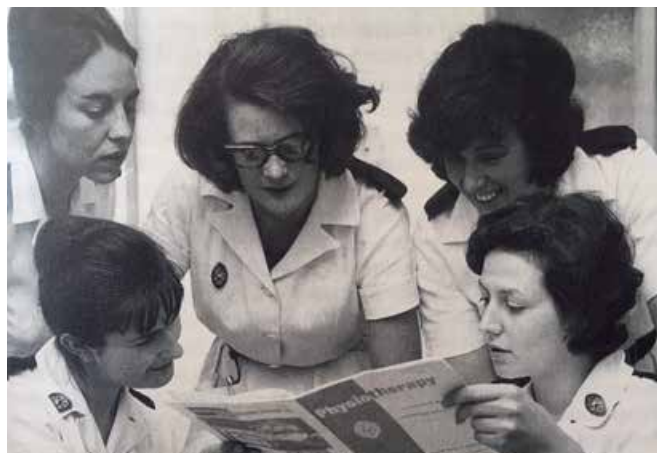
Fisioterapeutas británicas leyendo el volumen 50 de la revista Physiotherapy en 1964