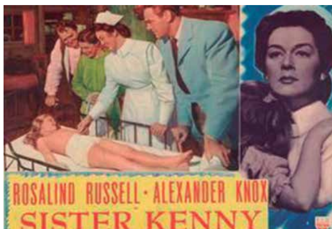
Fotogramas de la película Sister Kenny (1946), donde la actriz Rosalind Russell interpretaba la vida de Elizabeth Kenny