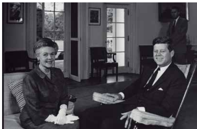
La doctora Janet Travell, médica de la Casa Blanca, junto al entonces presidente de EEUU, J.F. Kennedy