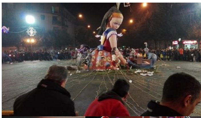
Fig. 1: ritual previo a la "cremá" participativa de la Falla Molinell-Alboraya.

Históricamente, el fuego siempre tuvo gran importancia para el hombre y su colectividad (Perceval 2015), desde la presencia de los primeros habitantes en el viejo continente europeo, hace 400.000 años.