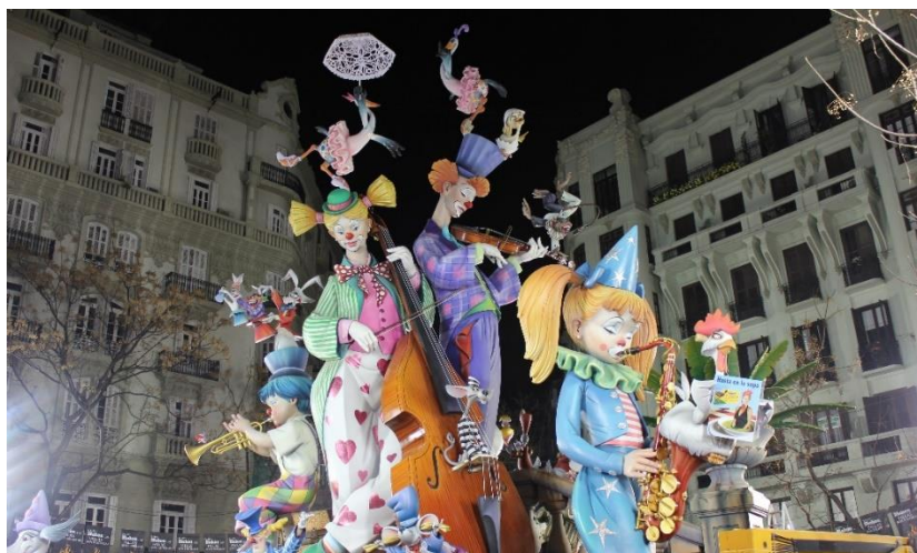
Figura 5: Falla Almirante Cadarso-Conde Altea 2012 de Manuel Algarra.

A lo largo del siglo XIX, la evolución del ritual ígneo lleva a distinguir todavía 4 tipos de fallas: hogueras que según antiguas costumbres encendían los labradores de la huerta delante de sus viviendas; hogueras de trastos viejos que se encendían en casi todas las calles de la ciudad; monigotes o ninots colgados de las ventanas, o de balcón a balcón o plantados junto a la frontera de las casas; y fallas monumentales, de boato o de rumbo, que consistían en una especie de tablado sobre el que se representaba una escena satírica (falla escenario) compuesta por varios ninots (Ariño, 1990). Éstas últimas, estaban en una proporción infinitamente menor al resto (en 1855 habían 1 ó 2, mientras que en 1866 solo hubo una), sobre todo respecto de las hogueras.