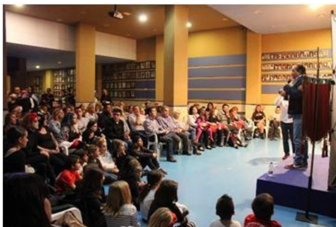
Fig. 4: La Falla como núcleo de sociabilidad y "esfera pública". Casal de la Falla Alquerías de Bellver-Garbí.

Uno de los sociólogos que más ha estudiado esta vertiente en la fiesta, tanto en su tesis doctoral como en trabajos posteriores es Xavier Costa (2003). En ellos realiza una investigación cualitativa etnográfica de la fiesta de Las Fallas a partir de los conceptos de sociabilidad, sociabilidad festiva, reflexividad y esfera pública. Se resume, a continuación, los resultados de su trabajo, para después desarrollar algunas de las conclusiones más relevantes desde el punto de vista de la sociabilidad.