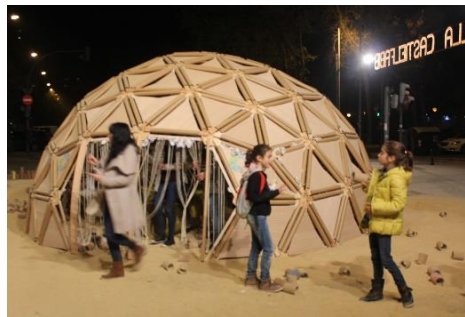
Figura 7: Falla Castielfabib 2014 plantada en la calle.

Para Gramsci (Serna y Pons 2011) la cultura popular es un campo de lucha desequilibrada, condicionada, por una parte, por la filosofía que marca las clases subalternas o el pueblo, y las clases históricamente impuestas, las dominantes. Obtiene una visión social constituida por dos grupos, el hegemónico, que controla y dirige, y el subalterno o subordinado. También habla del fenómeno de la alienación o manipulación que se produce cuando éstas últimas controlan y asumen como sentido común, a la ideología impuesta. Se observa que Gramsci asocia la cultura popular a la subalternidad.