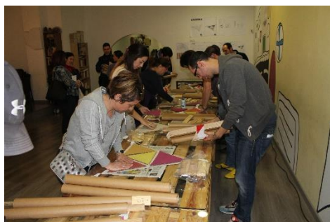
Figura 6: Falla Castielfabib 2014. Construcción participativa.

sin comisión, o sin grupo humano, no hay falla. En este sentido, es importante subrayar el concepto de cultura popular (o arte comunitario) desde la perspectiva de tres importantes autores que han estudiado y analizado en profundidad el citado concepto: Antonio Gramsci (1891-1937), Mijail Bajtin (1895-1975) y Peter Burke (1937).