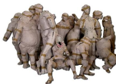
Fig. 10: Positivos de cartón.