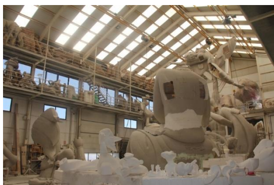
Fig. 11: Macrotaller del artista Pere Baenas.