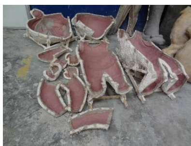
Fig. 9: Moldes de escayola para figuras de cartón.

propio y también la posibilidad de ventas a terceros. De esta manera, hacer una falla se convirtió en un modelo laboral sostenible, ya que, esto permitía al taller, conocer de antemano los costes de producción y, también, a las comisiones tener un presupuesto ajustado con antelación y con poco riesgo de variabilidad presupuestaria. Posteriormente, la aparición del poliéster o fibra de vidrio y, sobre todo, la eclosión del poliestireno a finales de los 80 en aras del volumen artístico y, más tarde, su adaptación a las nuevas tecnologías y procesos automatizados, en sincronía con los periodos de crisis económica, han permitido a los creativos incluso explorar y encontrar nuevos campos de trabajo como el cine, parques temáticos, escenarios de grandes conciertos, ferias, etc. en la industria del ocio y el entretenimiento (Ovejero 2009).