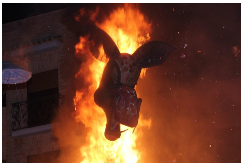
Fig. 3: "cremá" como metáfora depuradora del "mal".

de júbilo. Ejemplos claros de ello son la Passejá de Quart de Poblet en honor a Sant Onofre o La Rodà i La Pujà de Sant Roc en Burjassot. Aunque también existen festejos que expresan la idea de combate entre el hombre y el fuego, como las piromaquias, siendo ejemplo de éstas El bou embolat y La Cordà (Ariño 1990).