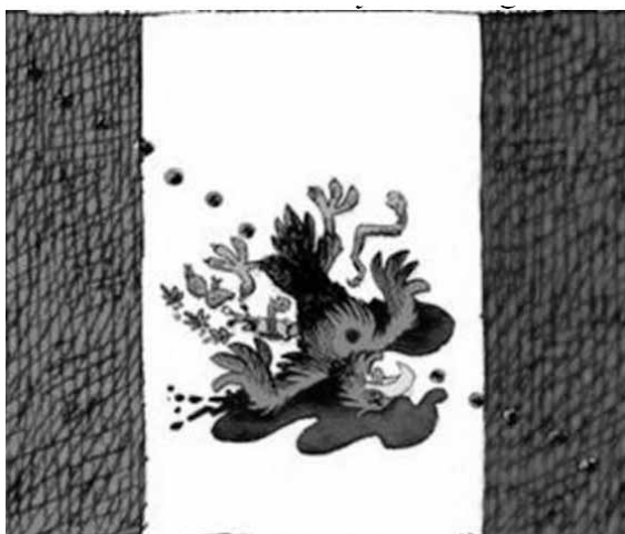
Caricatura sobre la violencia en México

Las identidades nacionales también participan de esta perspectiva crítica. Es el caso de la polémica caricatura firmada por Daryl Cagle publicada en la página web de la cadena estadounidense MSNBC sobre la violencia en México, con una deformación intencionada de la bandera y con el águila tiroteada 6 .