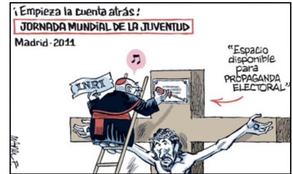
Diario Público , 08/2011 visita de Benedicto XVI a Madrid

Al mismo tiempo, es frecuente que en las viñetas se uti-