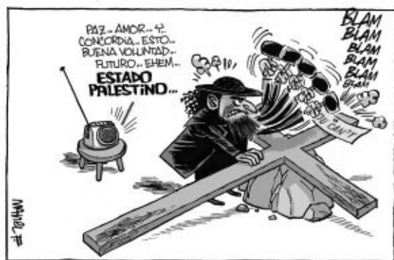
Manel Fontdevila, 2009, diario Público

Para analizar la representación de las religiones se selec-