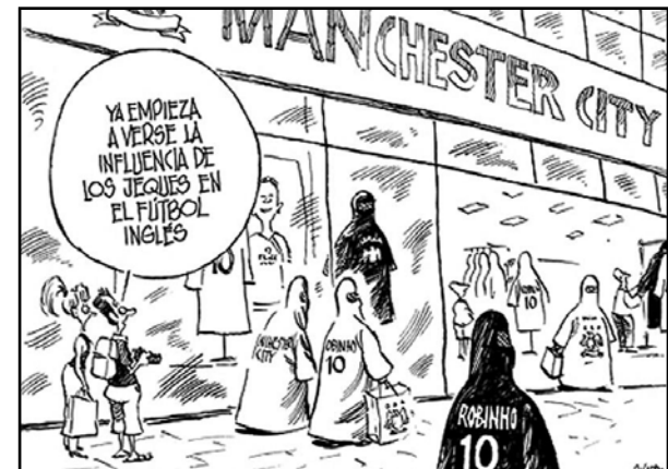
Ricardo, El Mundo , 04/09/09

En esta viñeta ( El Mundo , 04/09/09), el burka es el símbolo