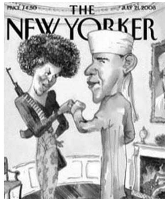
Obama y el islamismo según el New Yorker

su autor pretendía criticar los argumentos conservadores y no al entonces candidato a la Presidencia de los EEUU 8 .