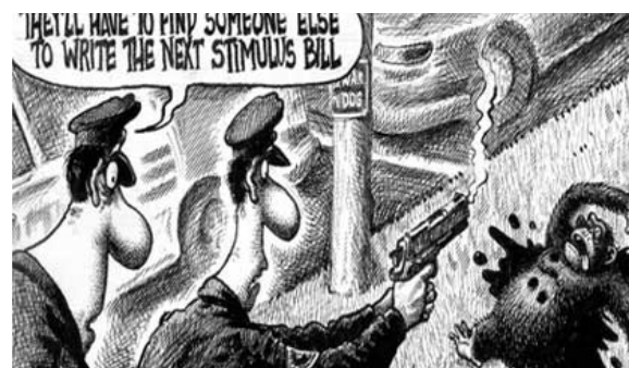
Caricatura del New York Post: ambigüedad del texto

Más clara, desde la óptica del discurso discriminatorio, es la imagen del New York Post en la que dos policías acribillan a un mono, por la ambigüedad del texto: "Tendrán que encontrar a otro para que escriba la próxima ley del estímulo" 9 . Aunque la caricatura podría ser interpretada a partir de un acontecimiento reciente -un chimpancé fue tiroteado en Connecticut- otras lecturas asociaban al animal con el máximo mandatario estadounidense que la vispera había anunciado la ley del estímulo económico.