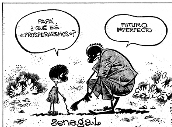
El Mundo, 04/06/06. Modelo conceptual hacia el ambiente social

En torno al mismo hecho, Idígoras y Pachi, en el diario El Mundo , trascienden el acontecimiento específico para situar en un campo de Senegal a un padre que, en la respuesta a su hijo, resume la ausencia de futuro. Aquí la mediación política cede terreno en beneficio de un modelo más conceptual que se centra en la tragedia de la inmigración.