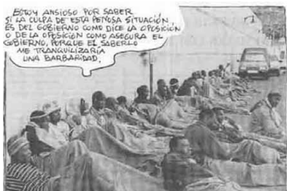
Mingote, ABC, 04/06/06. Modelo referencial hacia el sistema político

El dibujante Mingote, en el diario ABC, reproduce la imagen fotográfica de los inmigrantes. Estamos ante un modelo referencial, que a través de un bocadillo critica la actuación de