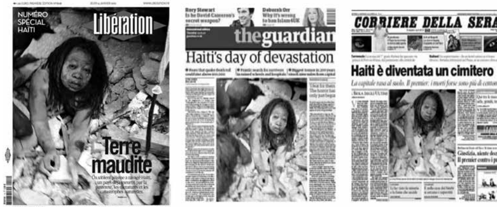
Figura 11: Ejemplo de “portada global” sobre terremoto en Haití (2010).