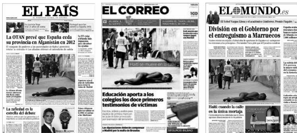
Figura 12: Portadas de diarios El País , El Correo y El Mundo (2010).

en el contexto informativo de la epidemia de cólera que castigaba la zona) si bien Haití, desde el terremoto, ya se había convertido en foco de interés informativo internacional y había movilizado a la opinión pública.