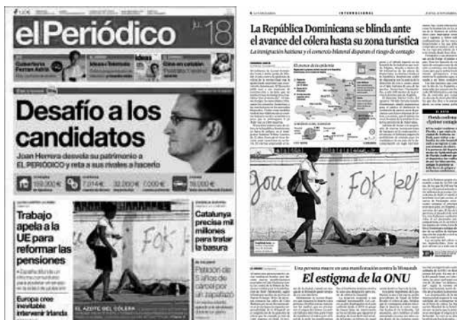
Figuras 13 y 14: Portada de El Periódico y página de “Internacional” de La Vanguardia (2010).