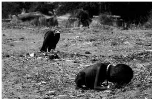
Figura 3: “El niño y el buitre en Ayod” (1993).