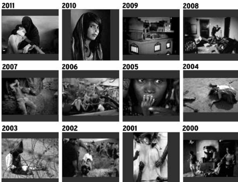
Figura 9: Fotos ganadoras del World Press Photo 2000-2011.

En la foto del 2007 se presenta a un soldado norteamericano en un búnker en el Valle de Korengal, Afganistán; en la del 2008 se trata de un investigador de la oficina del sheriff que entra a punta de pistola en una vivienda destrozada en Ohio (Cleveland, EE. UU.); en 2009, las mujeres protestan desde el tejado de una casa en Teherán en el contexto de las elecciones presidenciales en Irán. La foto del 2010 retrata a Bibi Aisha desfigurada por intentar huir de su marido en Afganistán; y la del 2011 a una mujer con velo junto a su hijo herido en una mezquita de Yemen.