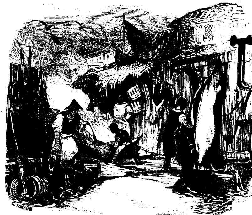
Les abattoirs de Séville.

Dolores n'avait point d'argent ; mais sa robe de soie était d'une magnifique étoffe, et sa mantille de la plus fine dentelle. Elle songea donc à se rendre au Rastro 1 pour y faire un échange. Là seulement elle pouvait, sans argent, se procurer un déguisement convenable.