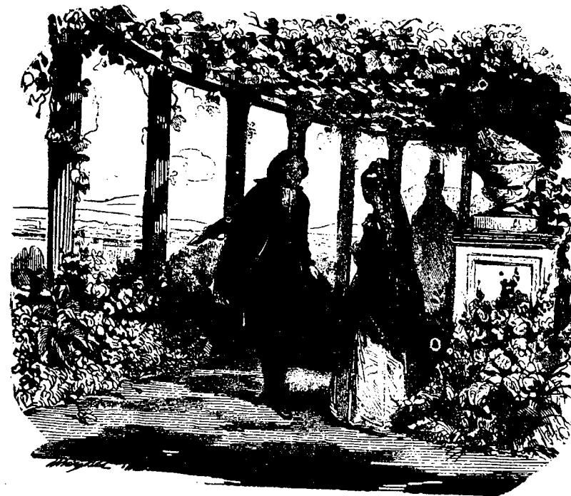
Pour te sauver ! dit José.

— C'est bien ! s'écria l'inquisiteur en se frottant les mains ; à nous deux