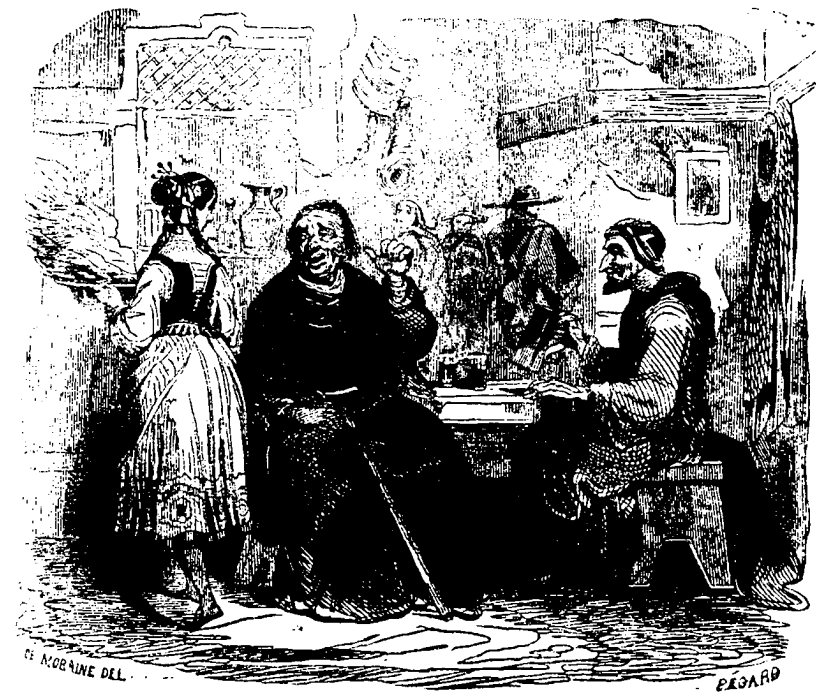
Elle servit à chacun

— Mon Dieu! dit-elle, votre tristesse m'épouvante, et pourtant j'ai foi en vous, et j'irai partout où vous voudrez me conduire... Et puis, ajouta-t-elle avec un peu d'hésitation, j'aurais encore autre chose à vous demander.