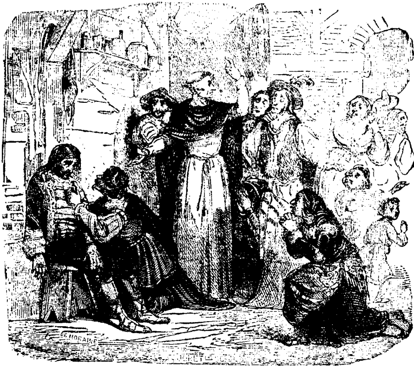
Il était curieux

— Oh! pardonnez-moi, dit-elle en joignant les mains; mais chaque pas que je fais dans la vie me conduit à un abîme, et cependant... Oh! je vous crois,