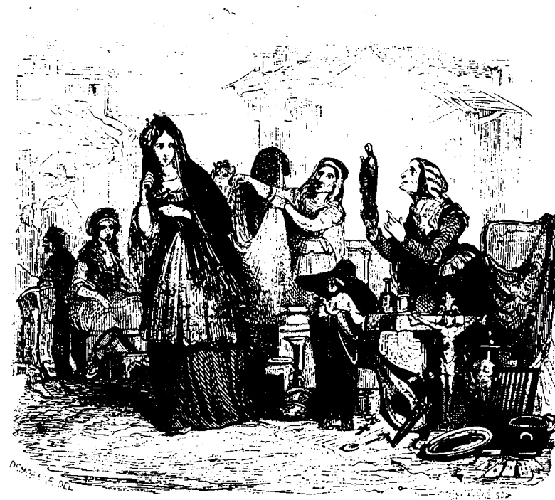
Achetez-moi cela !...

La chambre venait d'être éclairée par des torches de résine ; l'apôtre qui