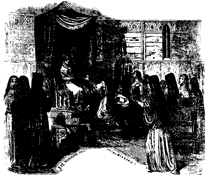
L'abbesse des Carmélites.

— Oh ! pensa-t-elle en elle-même, la liberté pour nous aussi !... Mais nous serons mortes avant qu'elle arrive, murmura-t-elle tout bas en répétant les