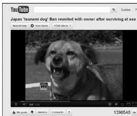
Figura 1: valores noticia y medios sociales.

En los nuevos medios la respuesta social a los mensajes introduce otro tipo de matices. Según el citado estudio de Rosenstiel y Mitchell (2012) un mes después del tsunami que afectó a Japón (2011), obtuvo gran popularidad un vídeo que mostraba la reunión de una mascota con su dueño (figura 1). Ingresan nuevos parámetros de cobertura en la medida en que testigos, webcams situadas en lugares públicos y organizaciones informativas se constituyen en fuentes de la noticia y el material audiovisual, muchas veces en bruto, ganando protagonismo.