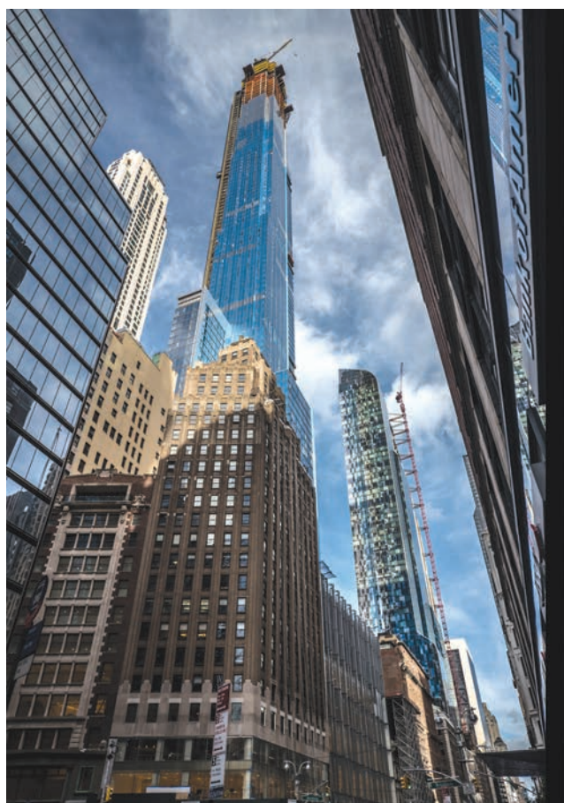
iii. 10, 11. Central Park Tower, design by Adrian Smith + Gordon Gill Architecture, 2021