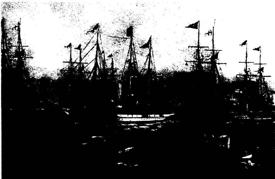
Fragmento del óleo de Antonio de Caula sobre la visita a Cartagena del rey Eduardo VII de Inglaterra, abril de 1907. En primer plano el Giralda , arbolando el estandarte del Rey Alfonso XIII.

que lucharían en la Primera Guerra Mundial. La otra gran alianza europea, la formada por los imperios alemán, el austro-húngaro e Italia, quedó dislocada con el alejamiento de Italia, «seducida» por la Entente y que osciló desde una primera neutralidad en la guerra, pese a su pertenencia formal a la Triple Alianza, a entrar en guerra justamente del lado de británicos, franceses y rusos contra sus antiguos aliados, apoyados ahora por el imperio turco, con lo que este bando fue denominado el de los «imperios centrales».