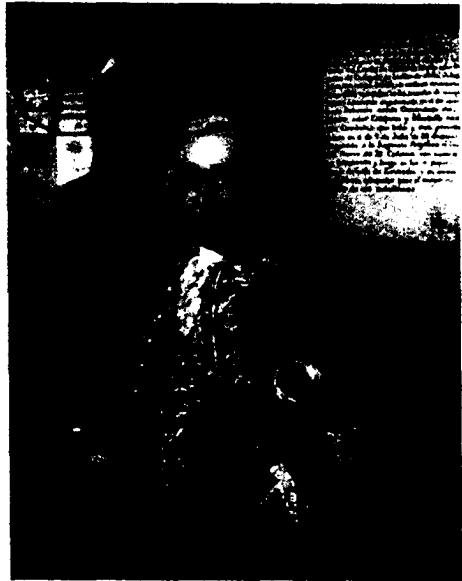
Isidoro García del Postigo. Jefe de escuadra. (Museo Naval. Madrid).

Habíamos dejado al Héctor dando caza a la fragata argelina, de 40 cañones y al mando del renegado Achí Mustafá, a la que empezó a batir con las piezas de proa y a ser respondido con los guardatimones desde las cinco y media de la tarde. El navío consiguió acercarse, y pronto la fragata perdió el mastelero mayor y el de mesana, quedando desmantelada y encerrada contra la costa.