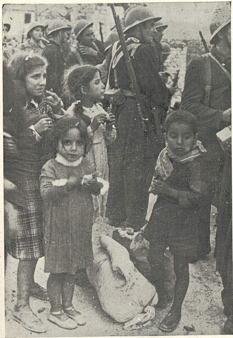
Orgullosos de la bochornosa «hazaña» vuelven los milicianos la espalda a estos niños que ávidamente roen un pedazo de pan.