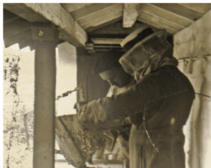
‘Manipulando abejas’, una fotografía de 1929.

de los Sindicatos Católicos Agrícolas Alkartasuna de Guipúzcoa siendo fundador de la Federación Católica Agraria, cuya presidencia ostentó por más de 40 años. También fue activo dirigente de las Anaitasunak (Mutuas del Seguro de Ganado) y presidente de la “Protectora” que, asimismo, cubría ciertos riesgos del ganado. Fue vocal de la Fundación Arteaga (Granja Arteaga). Cuando se hizo la reversión al Estado del puerto de Pasajes era presidente de la Junta de Obras.