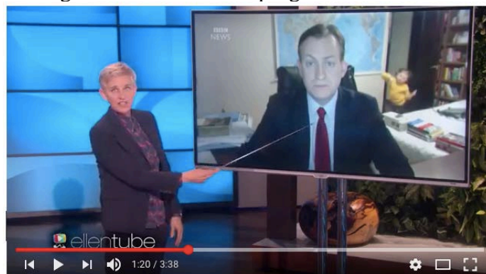
Figura 8. Análisis en el programa Ellen Show