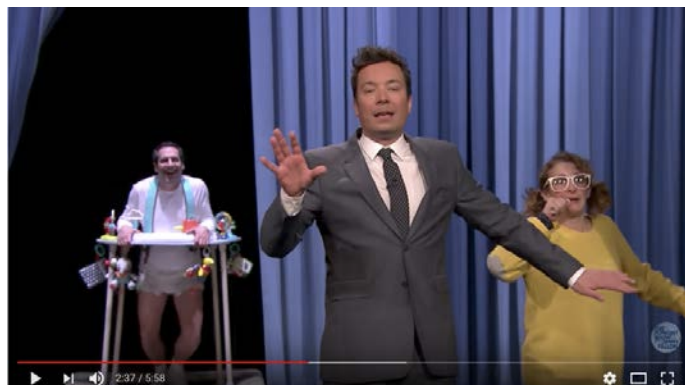
Figura 10. Interrupción del presentador en El Show