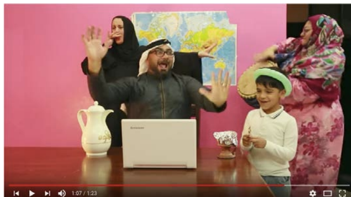
Figura 15. Recreación de Dubomedy Dubai