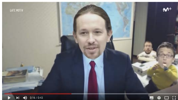
Figura 11. Parodia del programa Late Motiv

En España, destacan los programas de late night como Late Motiv (Movistar #0) dirigido por Andreu Buenafuente, que tratan la actualidad desde una perspectiva en clave de humor y que en esta ocasión, aprovecha el video viral para dar protagonismo a los miembros de Podemos, con el líder de la formación, Pablo Iglesias, al frente, acompañado por Íñigo Errejón y Pablo Echenique.