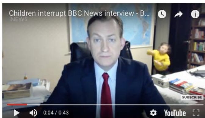
Figura 5. Vídeo original niños interrumpen entrevista en BBC News

La entrevista interrumpida tiene un alto impacto en las réplicas vía YouTube. El tag “BBC dad interrupted” genera en YouTube trends , 12.900 vídeos. Si atendemos al número de visualizaciones a escala global encontramos el vídeo BBC con 25 millones de visualizaciones.