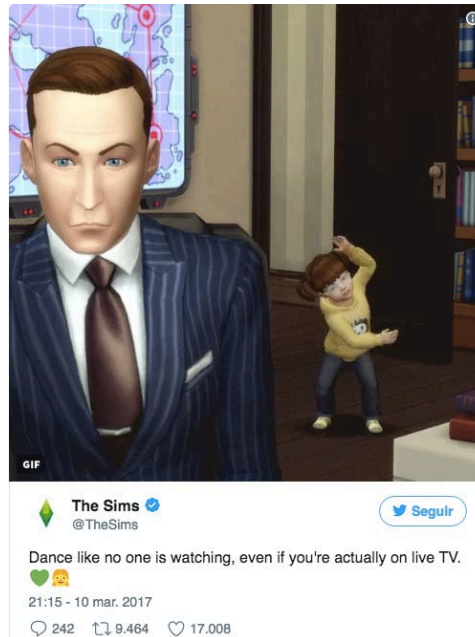
Figura 14. Perfil del videojuego de The Sims