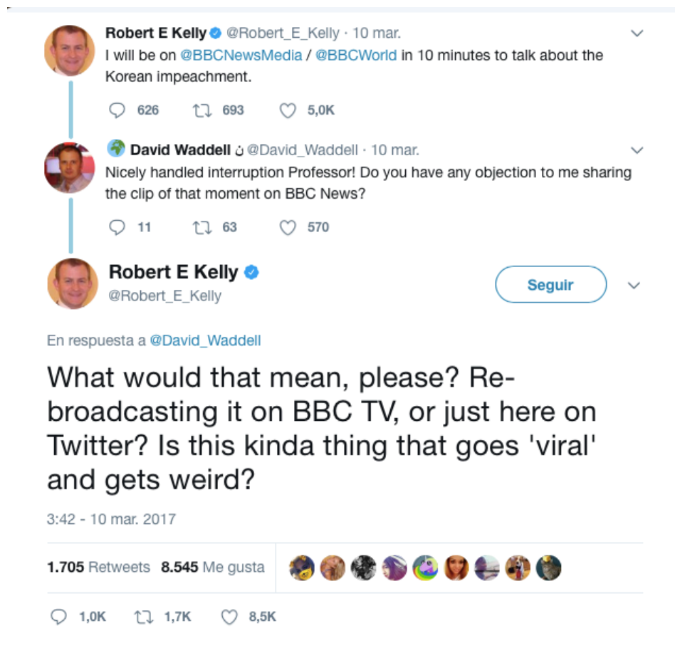
Figura 2. Comunicación en Twitter entre el profesor Kelly y el Social Media de la BBC Waddell