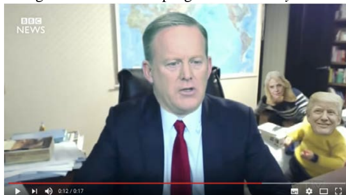
Figura 9. Parodia del programa The Daily Show

The Daily Show (Comedy Central) emite una versión con el gabinete del presidente de los Estados Unidos. El portavoz de la Casa Blanca, Sean Spicer ejerce de padre; Donald Trump y el secretario de Vivienda, Ben Carson, de niños; y la consejera presidencial Kellyane Conway de madre.