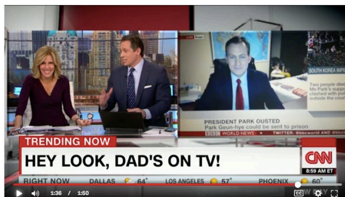
Figura 6. Vídeo en la cadena CNN