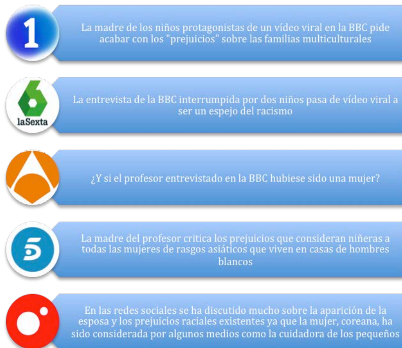
Figura 1. Tabla de rótulos destacados en las webs de las cadenas de televisión