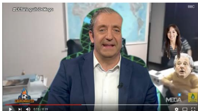
Figura 13. Parodia en El Chiringuito de Jugones

También en el programa deportivo El Chiringuito de Jugones , en Mega televisión, el equipo de Josep Pedrerol recrea la escena en la que aparecen diversos tertulianos. Como se puede observar el vídeo da juego también en los espacios dedicados a la actualidad deportiva.