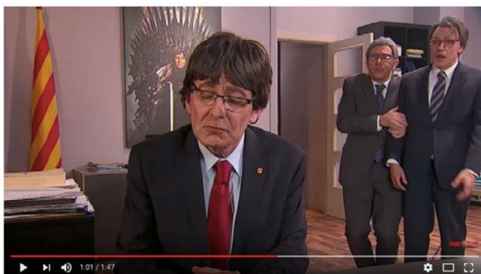
Figura 12. Parodia del programa Polònia