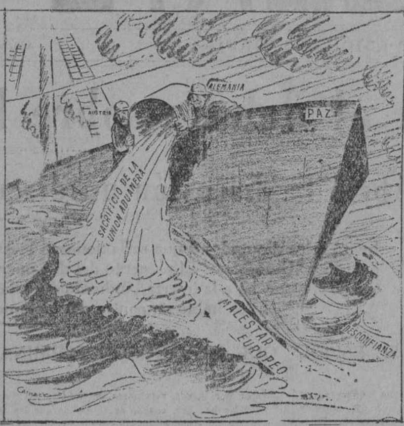
EFFECTOS DEL ACEITE EN LAS AGUAS ALBOROTADAS ("Boston Monitor")