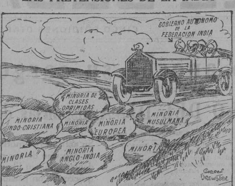
UN CAMINO CON MUCHOS TROPIEZOS (Irish Weekly), Independent.

ciudades, pidiendo a los obreros que cooperasen a establecer una República grande; pero si nos encontramos con que nos cerrará las puertas. Varios DIPUTADOS radicales: No, no. El señor BESTEIRO: Si no cerráis las puertas, tendremos que decir a nuestros correligionarios que esta República no es la nuestra y que es preciso hacer la revolución social. (Aplausos de la minoría socialista.) Desde otros bancos se nos pide a los señores prudentes; pero es preciso que los demás tengan también la prudencia de dejarnos libres los brazos para trabajar por la República y por España. (Aplausos de los socialistas.) El señor OSSORIO Y GALLARDO: Ha hecho el señor Besteiro un llamamiento para que no se le cierre el paso a la socialización de la propiedad. Y esto, ni en el anteproyecto ni en el proyecto se hace. Al contrario, la puerta queda abierta desde el momento en que se consigna que la propiedad "podrá ser socializada". Nadie defiende que la propiedad da derecho a usar de ella con absoluta libertad. Defiende alguien en esta Cámara el liberalismo económico? Seguro estoy que no. Esta misma tarde ha tenido su condenación en labios del señor Gil Robles.