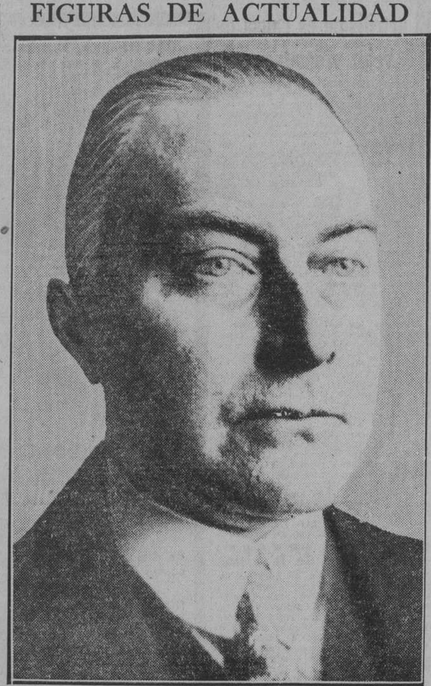
El señor Curtius, ministro de Negocios Extranjeros de Alemania, que ha presentado la dimisión de su cargo