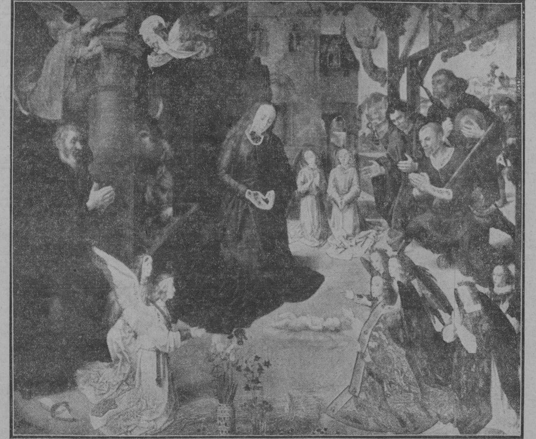
Para muchos críticos es esta obra la más genial creación del enigmático Van der Goes, el sencillo pintor flamenco, que no conoció ni los palacios de los grandes ni las auras volanderas de la fama. Y, en efecto, este cuadro, central del famoso Tríptico Portinari, revela una composición del más exquisito gusto, una belleza de colorido sorprendente y una habilísima distribución de luces y sombras.

Con el fin de que nuestro personal pudiera celebrar en familia la Nochebuena, el presente número de EL DEBATE ha sido cerrado a las nueve de la noche