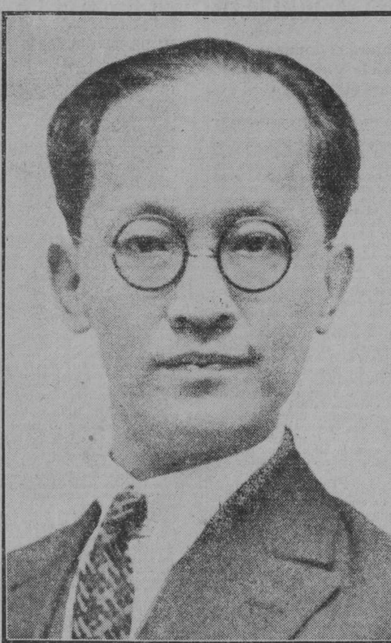
El doctor Sun Fo, nuevo presidente del Comité Ejecutivo de China

Otra línea férrea a través de los Andes en la huelga Los azucareros persisten en no han llegado a un acuerdo para resolver el conflicto