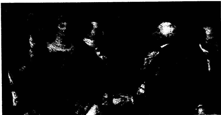
Ilustración del programa de actos.

mes de agosto y apresando de paso un convoy de 24 mercantes en las islas Sorlingas.