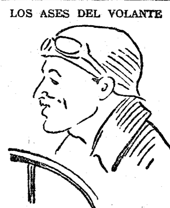
Jules Goux. Corredor veterano, uno de los primeros inscritos en la Targa Florio...