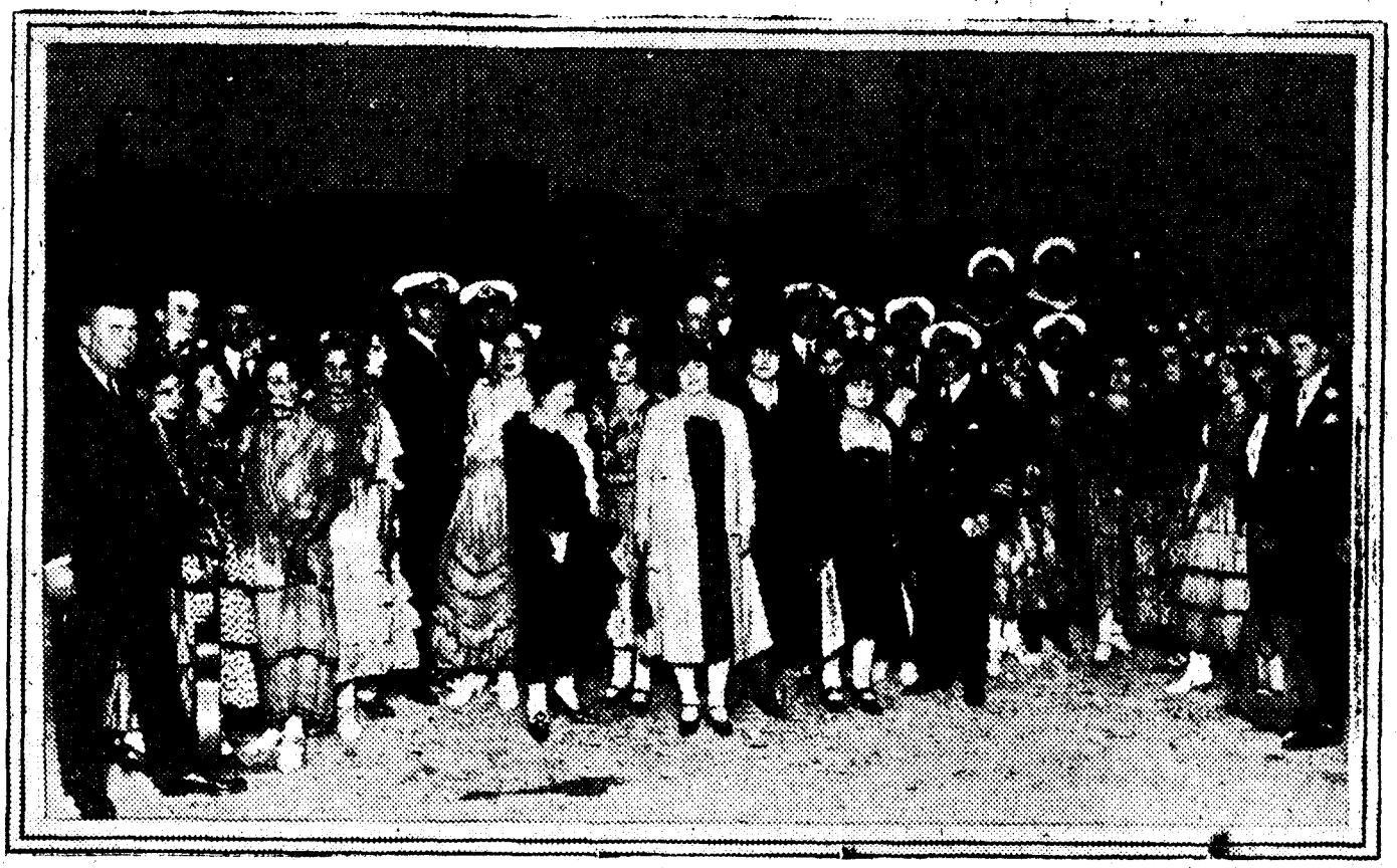
Granada.—Los marinos argentinos, acompañados del cónsul y vicecónsul de su país y de los socios del Centro Artístico, que les obsequiaron con una zambra gitana en Sacro Monte