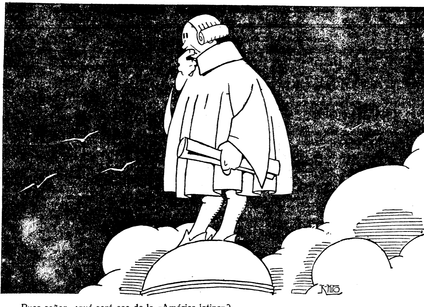
—Pues señor, ¿qué será eso de la «América latina?»