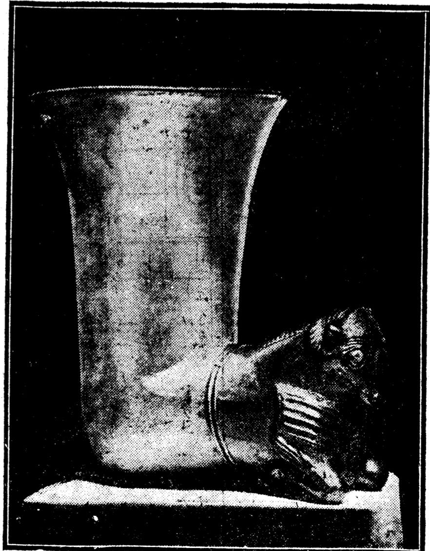
Esta copa fué encontrada en Marash (Anatolia), el lugar que ocupaba la antigua Hittite, y se halla ahora en el Museo británico. El cuerno es de plata, y el toro que lo sostiene, de oro; mide algo más de 20 centímetros de alto. Según mister Leonard Woolley, se trata probablemente de un trabajo de un artesano local, que vivió en el siglo VI antes de Jesucristo, cuando predominaba la influencia asiria.