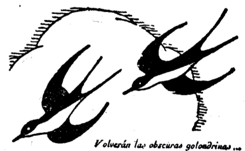
Volverán las oscuras golondrinas... BECQUER

Más de 150 caballeros y unas 800 señoras de la feligresía de la parroquia de Santiago y San Juan Bautista, presididos por el párroco, que llevaba un crucifijo entre las banderas de los Jueves Eucarísticos y la del Centro de Juventud Católica, hicieron ayer tarde las visitas jublares.