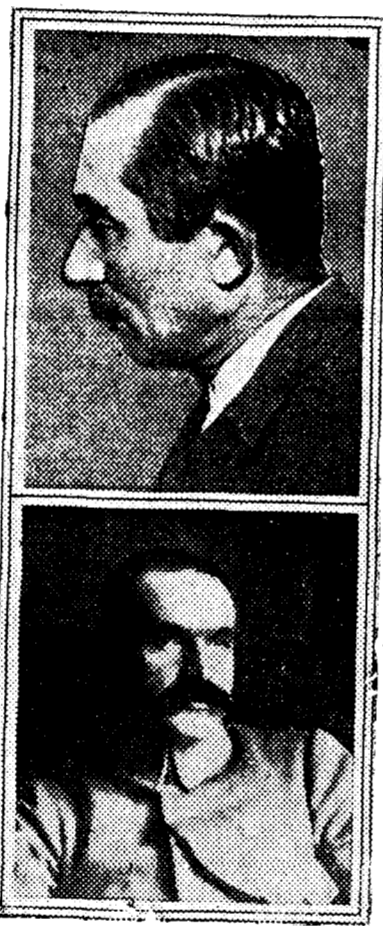
Arriba: Władysław Sikorski, jefe del Gobierno polaco, que se constituyó el día 11 pasado. Abajo: El mariscal Pilsudski, jefe de la sublevación