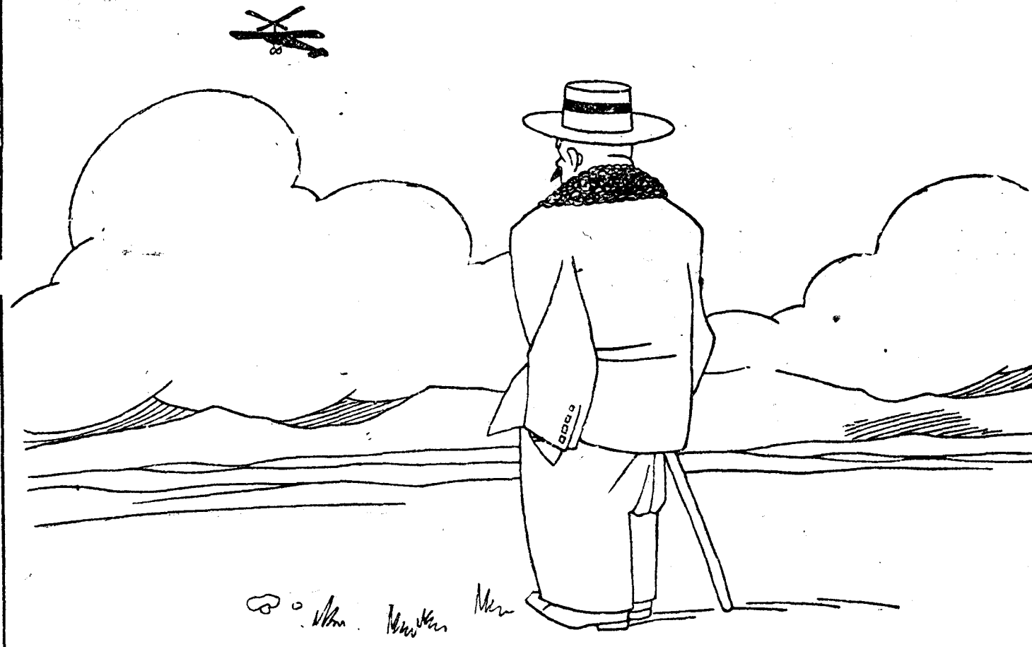
—¿Dónde está ya! ¡Lástima será que lo perdamos de vista!