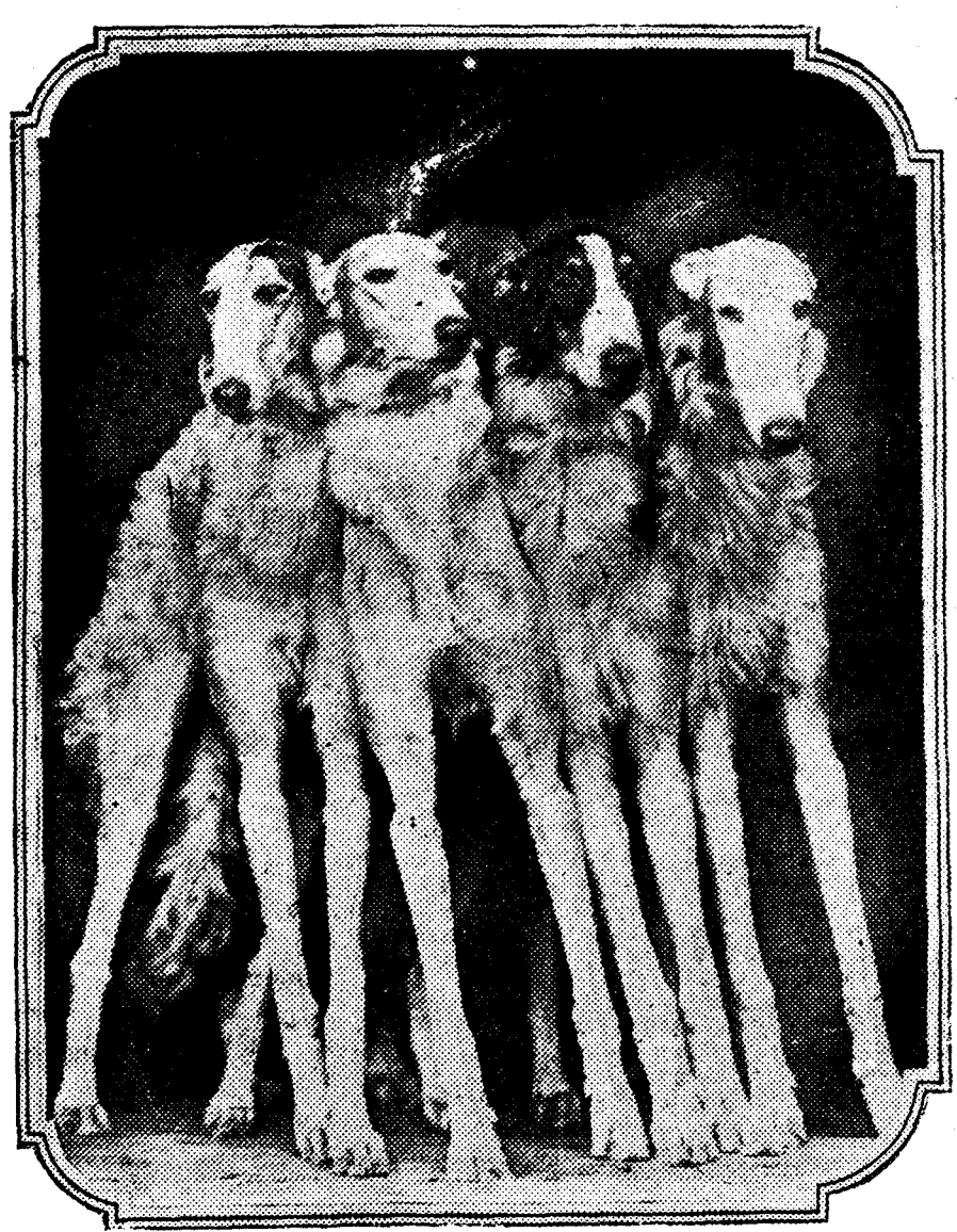
Así llama la Prensa norteamericana a estos cuatro ejemplares de perros lobos rusos, que los señores Frankern han presentado en la Exposición celebrada recientemente en Chicago, y que han obtenido premio especial. Todos ellos tienen menos de un año.