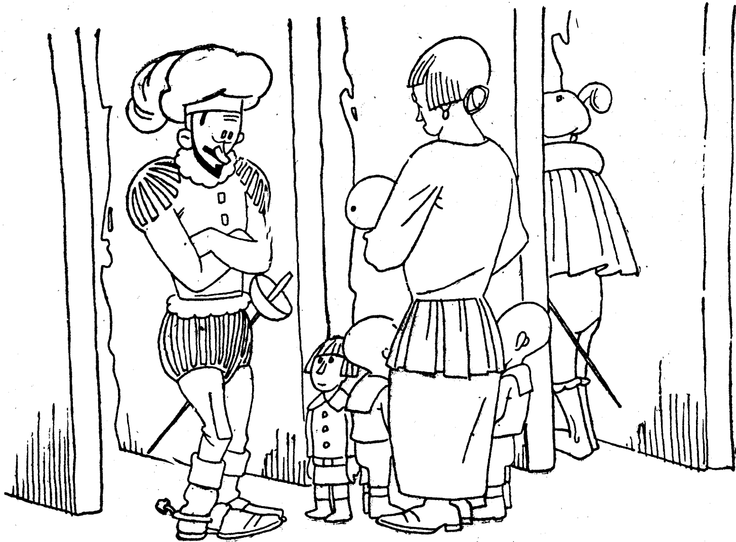
—Oye, Casiano, ¿dónde dejaste el biberón del pequeño, que no lo encontramos por toda la casa?