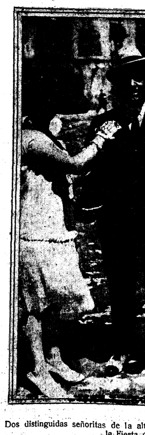
Dos distinguidas señoras de la alta sociedad burgalesa en el día de la Fiesta de la Flor