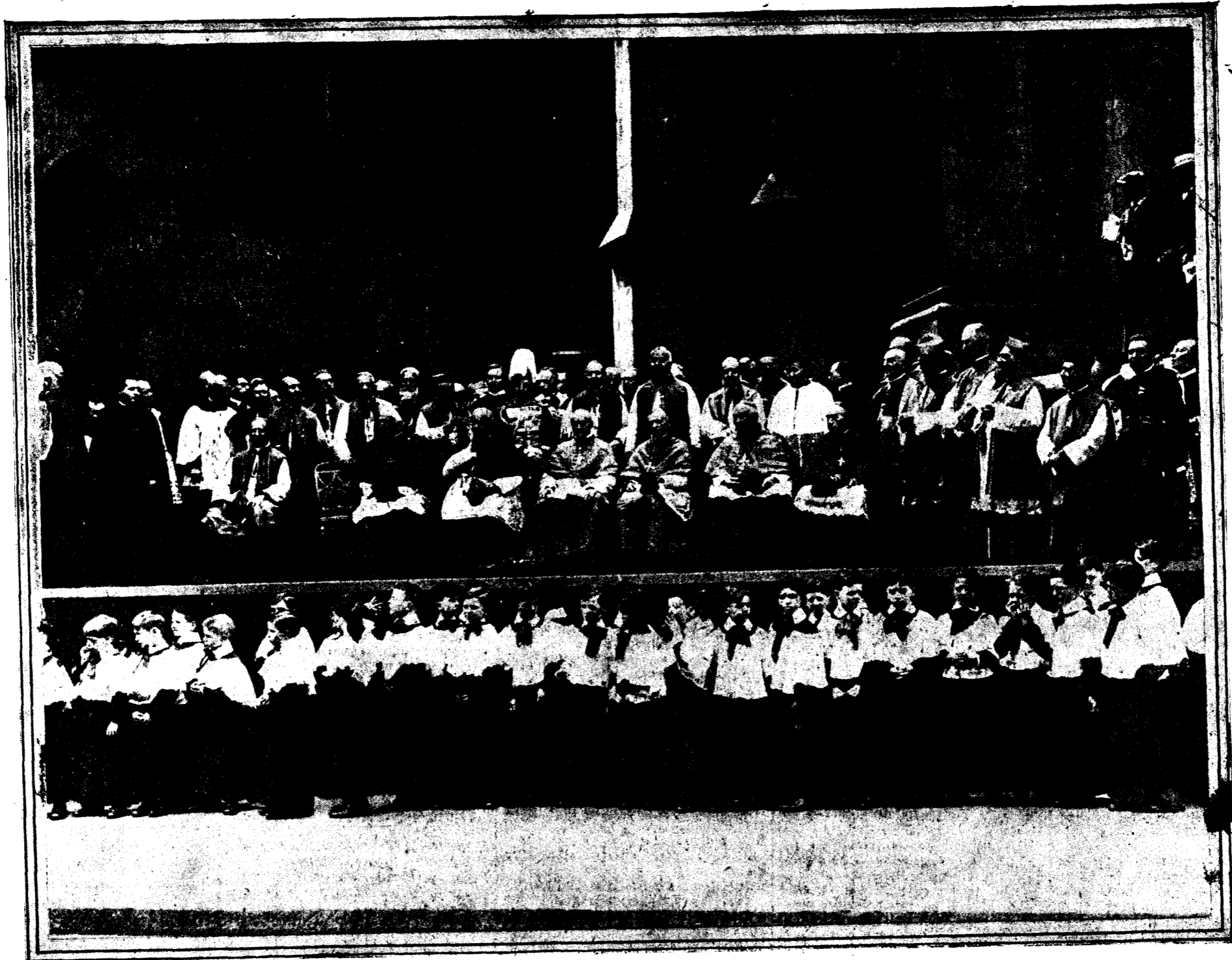
Dignatarios de la Iglesia Católica, a los que en Nueva York se les tributó la más grandiosa manifestación religiosa que registra la historia, al dirigirse hacia Chicago para tomar parte en el Congreso Eucarístico Internacional. En la fotografía aparecen los Cardenales O'Donnell, Charoste, Reig Casanova, Primado de España; Dubois, Pífil y Czneri och, presenciando la manifestación desde la fachada de la Catedral de San Patricio de la Avenida Madison