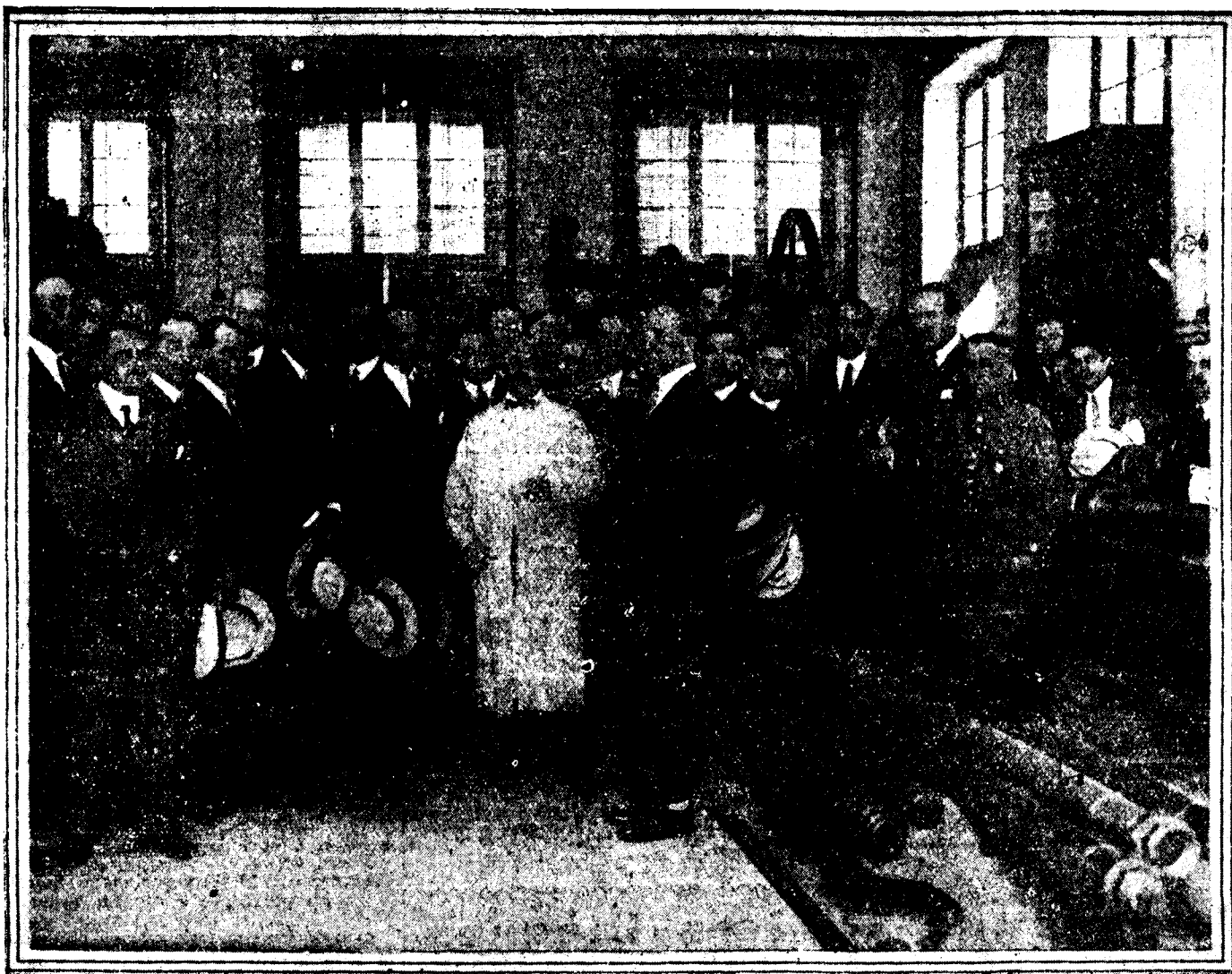
Los miembros del Congreso del Motor y del Automóvil visitando los talleres del Centro Electrotécnico