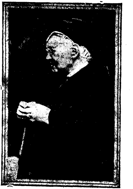
La reina Olga de Grecia, que ha fallecido en Roma