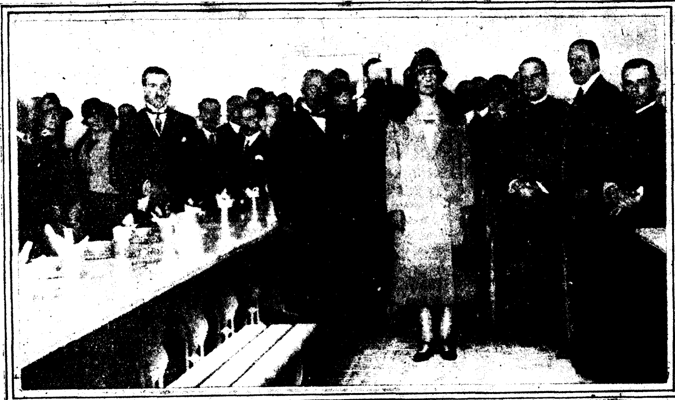
La familia real y autoridades visitando las dependencias del benéfico establecimiento