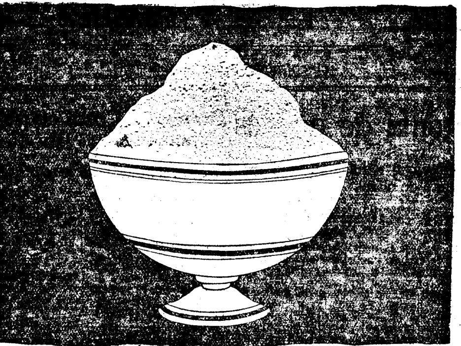
Azúcar de Tazza