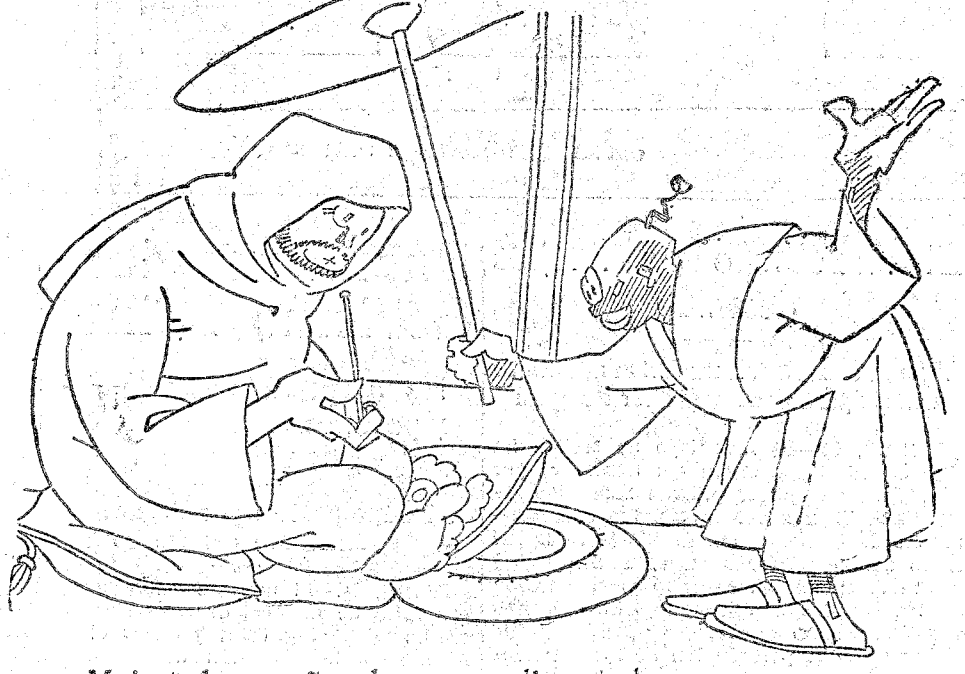
—Majestad, un señor desea cumplimentarle. —Que pase. Será el presidente del Consejo de hoy domingo.