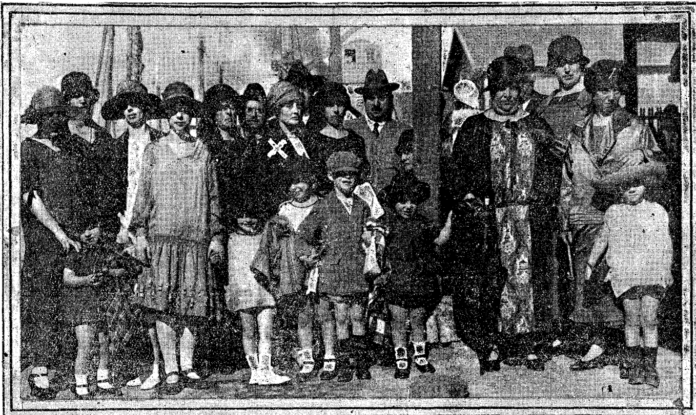
La esposa del general Gomes da Costa (X) al salir para las Azores, donde se reunirá con su marido, rodeada de sus hijos, hijos políticos y nietos