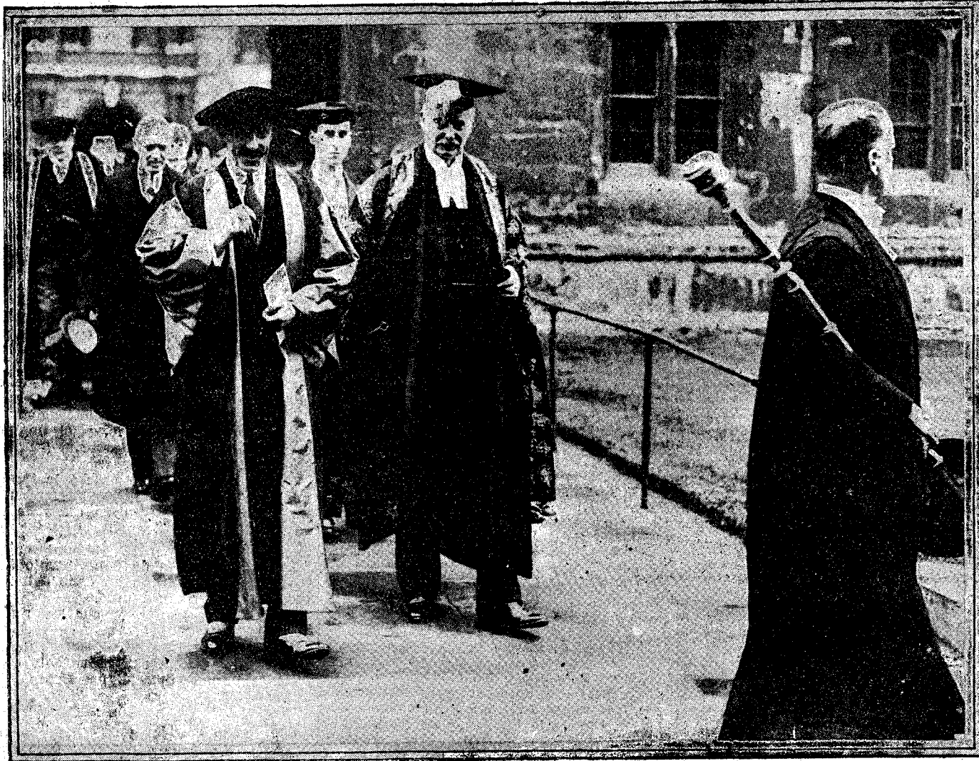
Su majestad, vistiendo la toga y birrete de doctor, al salir de la Universidad inglesa de Oxford, después de recibir el título de doctor honorario. Le acompaña el rector de la Universidad, lord Cave