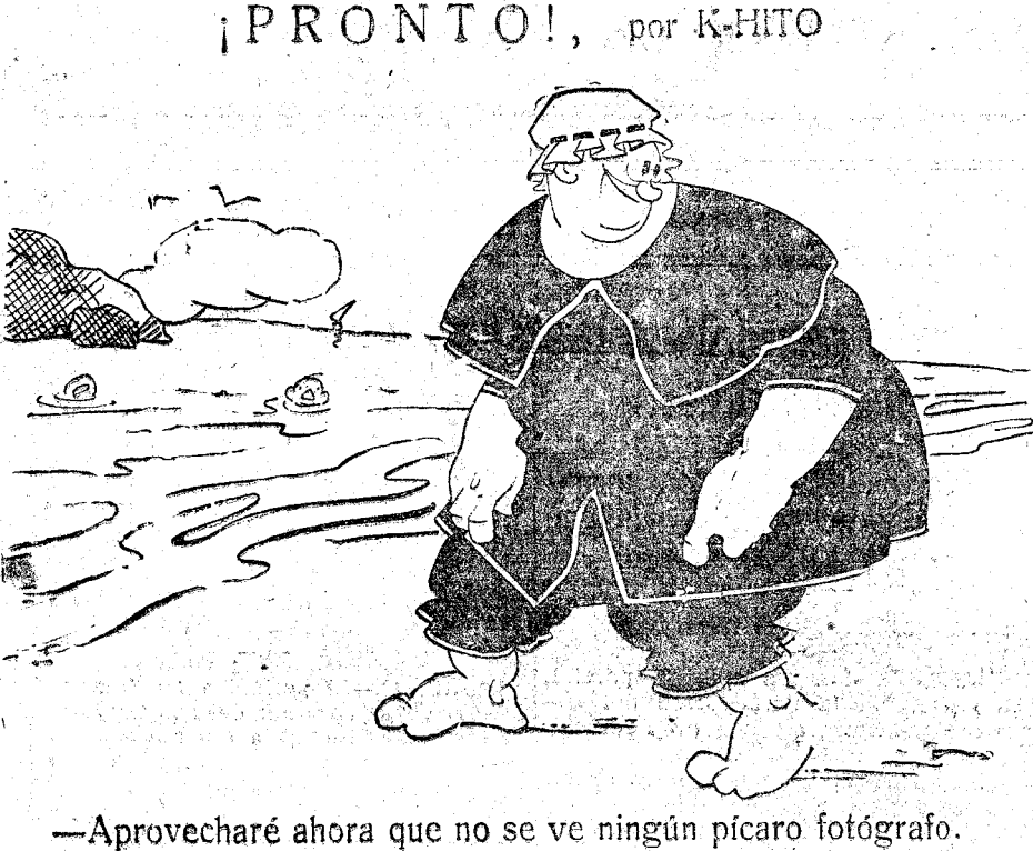
—Aprovecharé ahora que no se ve ningún pícaro fotógrafo.

SANTANDER, 19.—El barco rotor «Barba» zarpó a las 205 de la tarde con rumbo a Valencia.