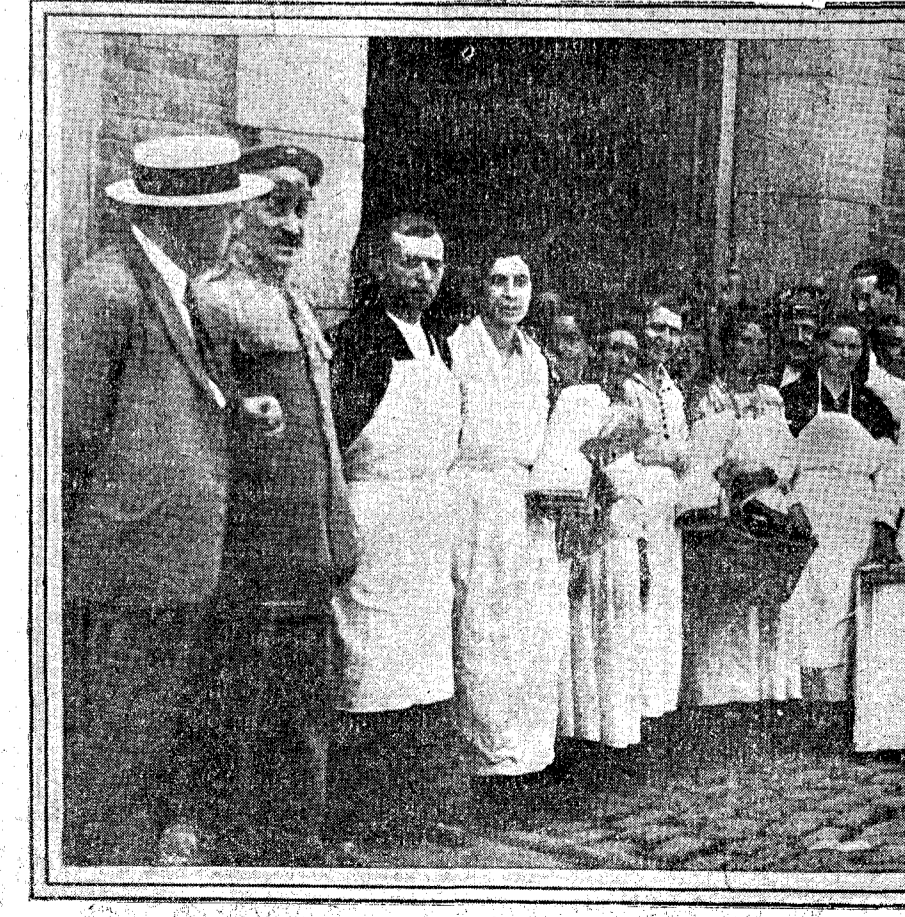
Los vendedores ambulantes de pescado del mercado de los Mostenses con el uniforme impuesto por el concejal delegado de abastos, señor Garcilaso de la Vega.