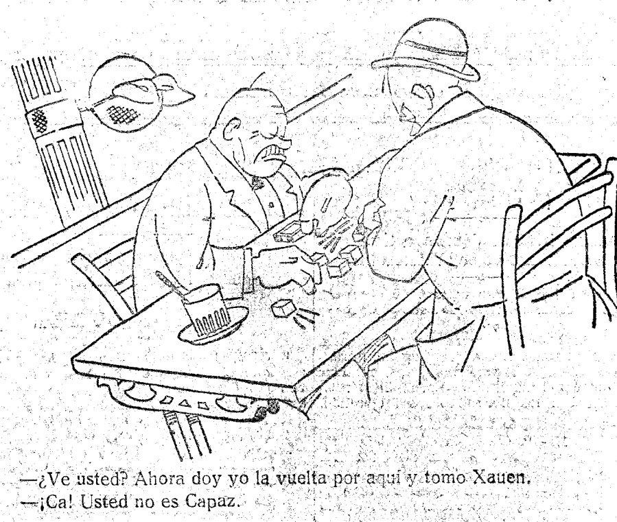
—¿Ve usted? Ahora doy yo la vuelta por aquí y tomo Xauen. —¡Ca! Usted no es Capaz.