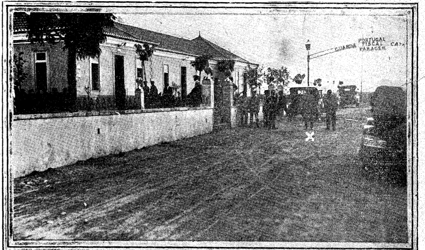
El general Carmona visitando el puesto de la guarda fiscal en la provincia de Badajoz, limítrofe con la nación portuguesa