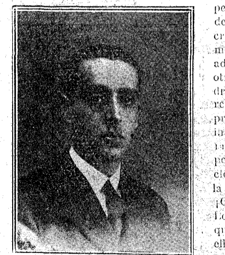
Don Leopoldo Calvo Sotelo

pero nunca seremos ni al servicio del Estado, si el Estado paga sin descubridores. No tener en cuenta la voluntad del funcionario? Ni creamos: interpretamos, desinvolvemento, la a cuantos ingresan en un escalafón. No hay en adoptamos: lo que este sistema otro mérito que el de los años; e otros han creado. No drizas burocráticas, rreminuciamos a a propiedad de conciencia intelectual para amarrantar a nuestros pedijos la prole en-ciente habida por la Administración.