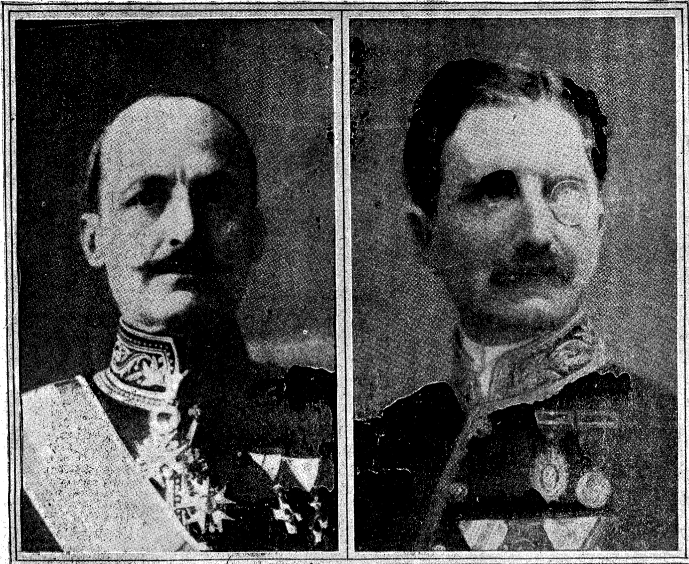
A la izquierda: El embajador en los Estados Unidos de América del Norte, señor Padilla. A la derecha: El ministro plenipotenciario en los Estados Unidos de Méjico, señor marqués de Rialp

Don Alejandro Padilla Bell nació en 26 de junio de 1869, ingresando en la carrera diplomática en 1892, y prestando en Washington sus primeros servicios. Fué después secretario en Lisboa, Londres, Buenos Aires y Tánger. Figuró en las Embajadas extraordinarias a Fez y en la organizada para asistir a las exequias de la reina Victoria de Inglaterra.