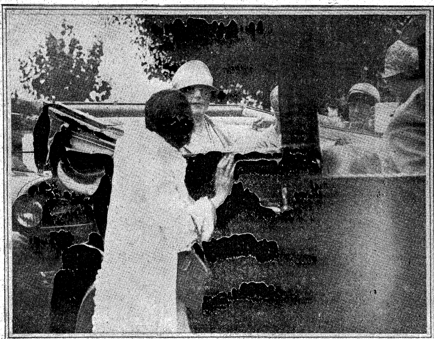
Un «asalto» a la Reina