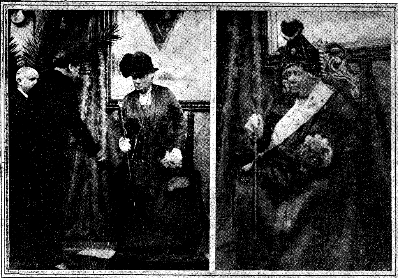
Su alteza real la infanta doña Isabel recibiendo del alcalde de Segovia, señor Rivas, el bastón de alcaldesa honoraria de dicha ciudad. La Infanta con la montera segoviana y demás atributos