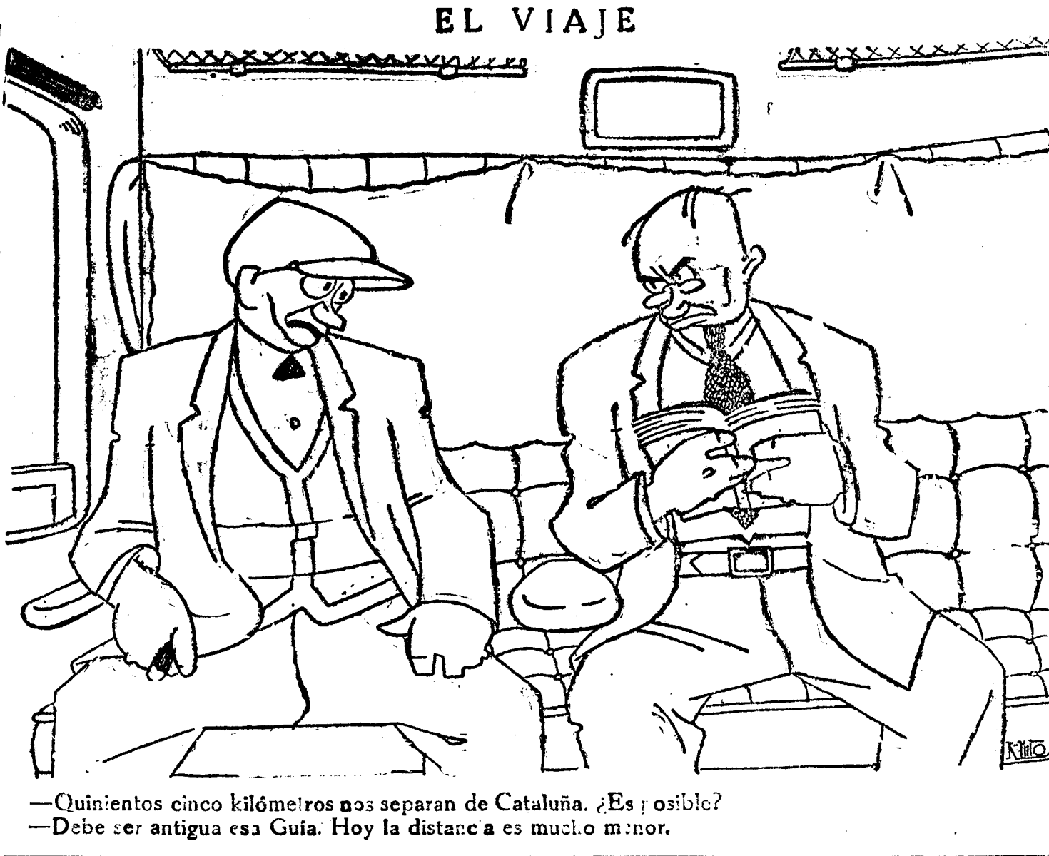
—Quientos cinco kilómetros nos separan de Cataluña. ¿Es posible? —Debe ser antigua esa Guía. Hoy la distancia es mucho menor.

Entre otras cosas, se dispone lo siguiente: En íntima conexión con el Estado Mayor Central, se crea en el ministerio de Marina una Subsecretaría, que entenderá en todos los asuntos atribuidos actualmente al almirante jefe de aquel Alto Cuerpo por el reglamento orgánico del expresado ministerio y demás disposiciones vigentes, con la única excepción de aquellos que taxativamente se asignan al Estado Mayor Central en el presente decreto.