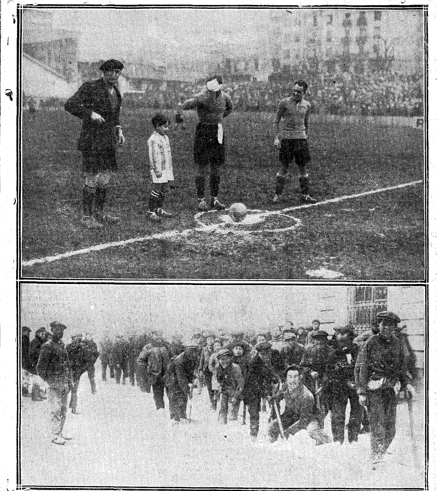
SAN SEBASTIAN: El hijo de Eizaguirre, que dió el 'kick off' en el partio de despedida de su padre, el famoso portero de la Real Sociedad. —ALBACETE: Brigadas de obreros contratadas por el Ayuntamiento para limpiar de nieve las calles.