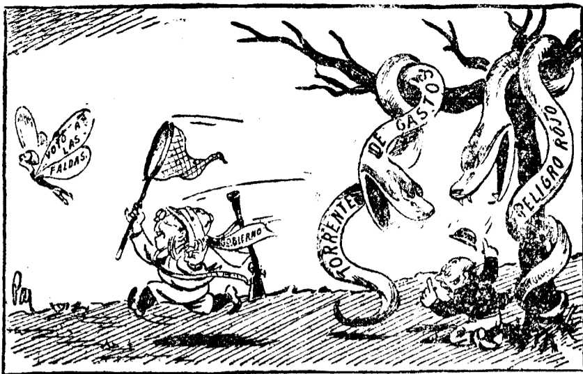
EL CAZADOR NO VA A ESTAR EN TODO (Del Daily Mail, Londres.)