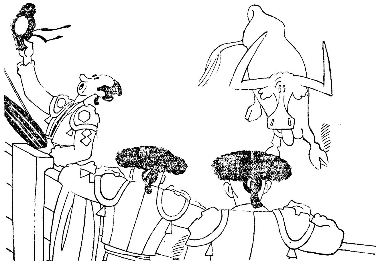
—¿Qué barbaridad! Lleva media hora brindando. —Es que está pidiendo permiso para ir a ver a una tía suya que se encuentra enferma.