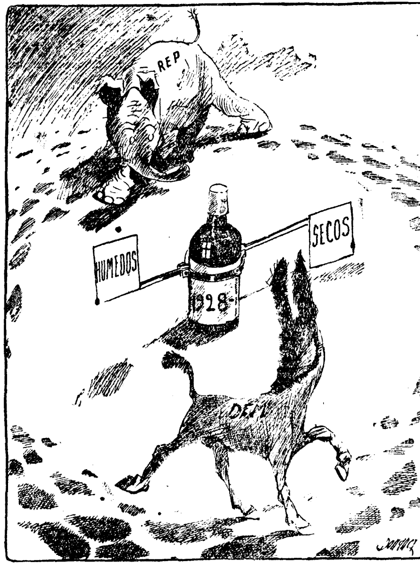
IPROHIBIDO! (Del Cleveland Plain Dealer, Cleveland)

Es costumbre entre los caricaturistas norteamericanos simbolizar (es todo un símbolo) al partido republicano por un elefante y al partido demócrata por un asno. En la caricatura vemos a ambos partidos sin saber por cuál de los dos banderines decidirán.