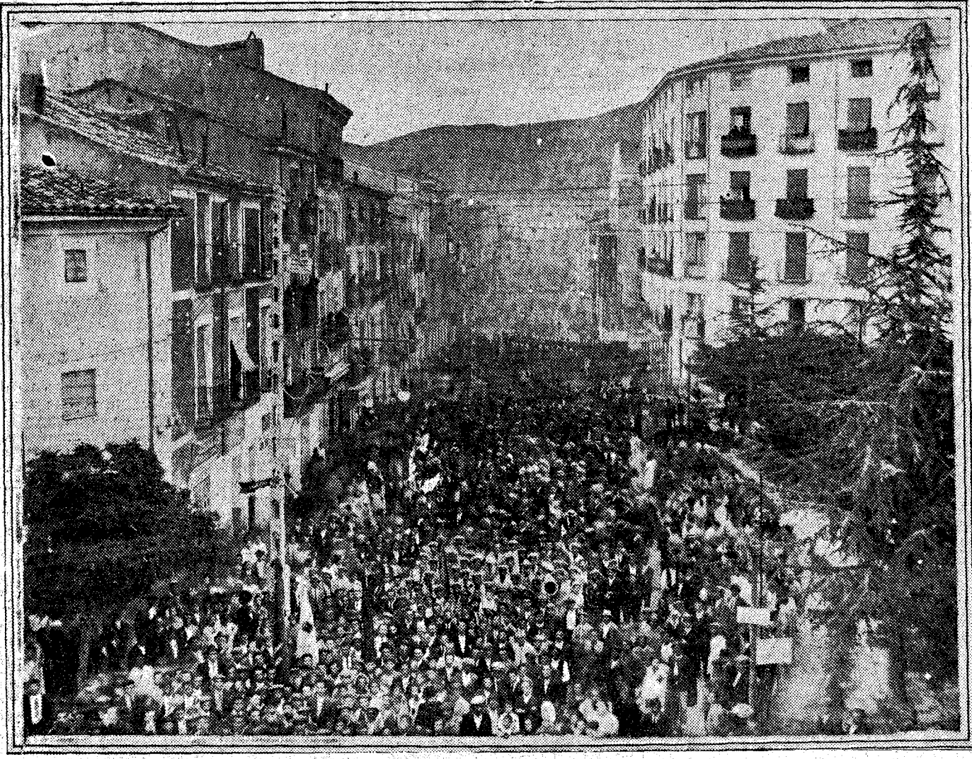
Manifestación popular en Cuenca con motivo de la adjudicación del ferrocarril Cuenca-Utiel, dirigiéndose al Gobierno civil para expresar el júbilo de la capital por tal mejora y su gratitud al Gobierno por haberla concedido