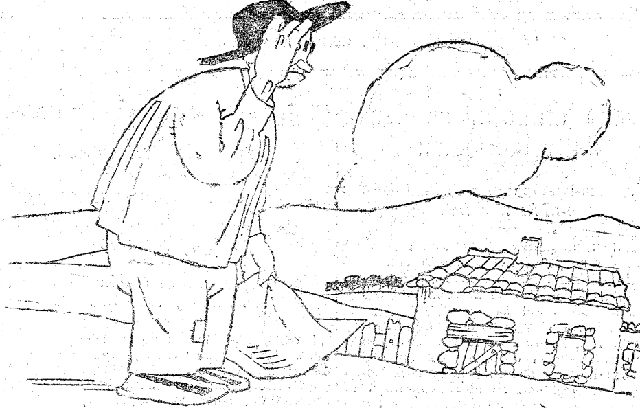
EL ELECTOR.—Se están poniendo las cosas como para no fumar un habano en diez años.