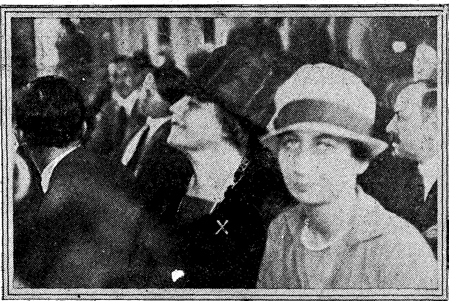
La viuda del ex presidente yanqui Wilson (X) asiste en Ginebra a la sesión inaugural.