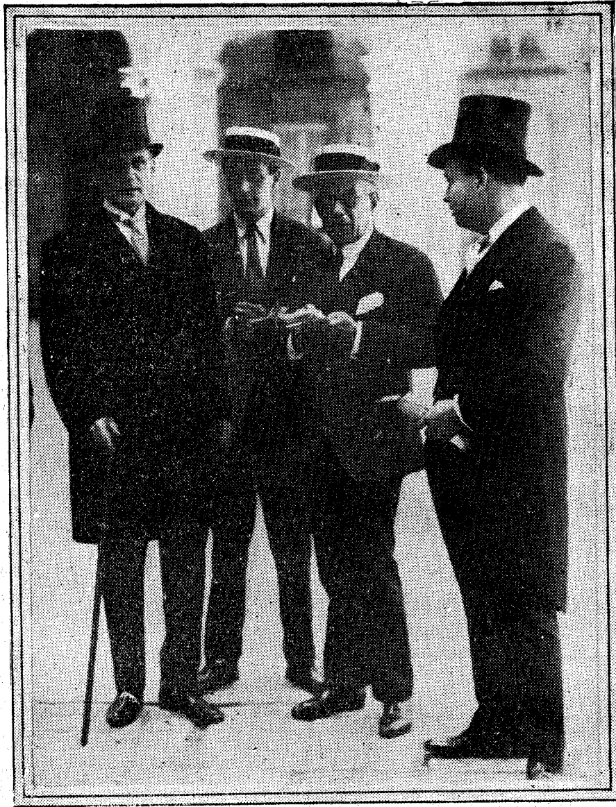
El ex embajador de los Estados Unidos en España, mister Alexander P. Moore, al salir de Palacio después de entrevistarse con su majestad el Rey para invitarle a la Exposición de Filadelfia.