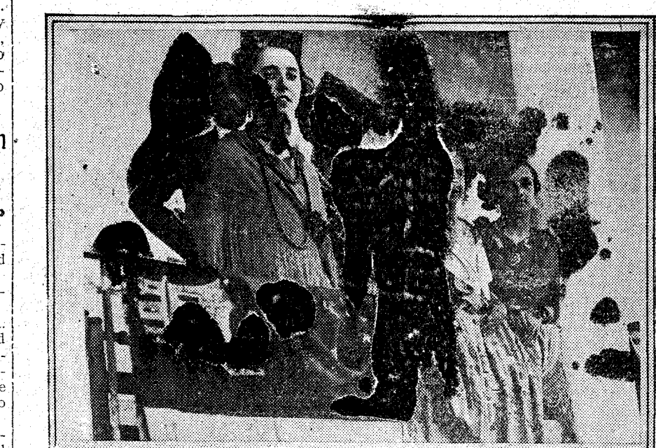
Señoritas que presidieron la becerrada aristocrática celebrada en honor de la colonia veraniega en Aracena (Huelva).