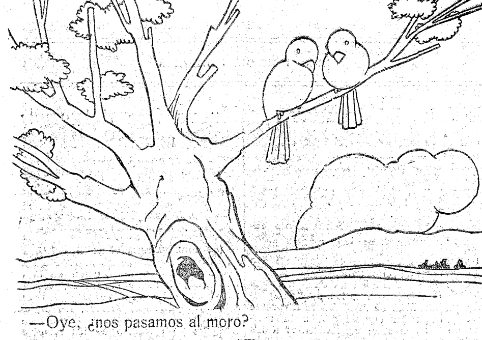
—Oye, ¿nos pasamos al moro?