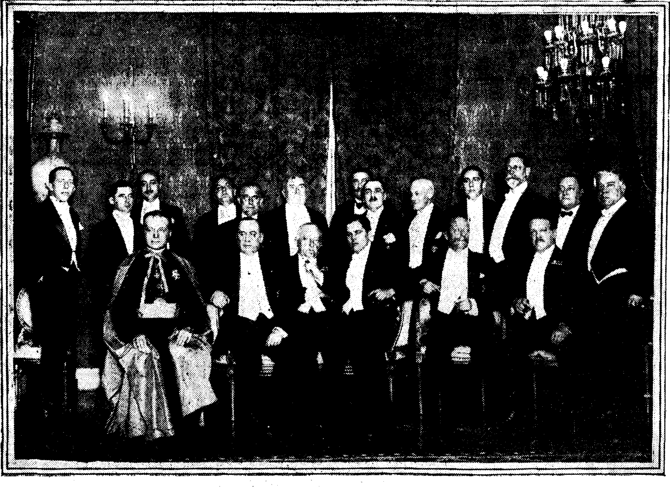
El Nuncio de Su Santidad, el embajador de Cuba, el presidente del Consejo y el director del «Diario de la Marina», de la Habana, con otras personalidades después del banquete dado en honor del ilustre periodista cubano en el Embajada de su país.