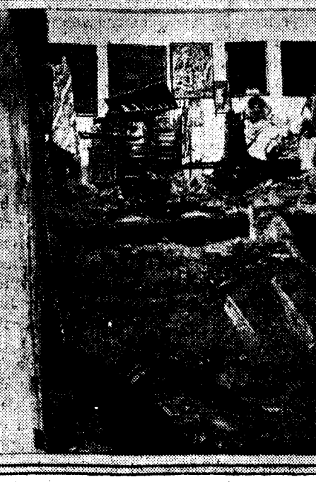
SAN SEBASTIAN: El jugador «Kiriki», de la Real Sociedad de San Sebastián, accionando al portero del Real Unión de Irún en el partido celebrado el domingo en la capital de Guipúzcoa, y en el que venció el primer equipo. CORDOBA: Ruinas de la ermita de la Montaña, hundida totalmente a consecuencia de una tormenta.

No todos ellos pilotarán un aparato cada uno, ni aun siquiera harán el vuelo juntos, ya que se seguirán itinerarios distintos, y hasta se utilizarán aparatos de distinta clase. Parece definitivamente acordado que estos vuelos se celebren en el mes de diciembre próximo.