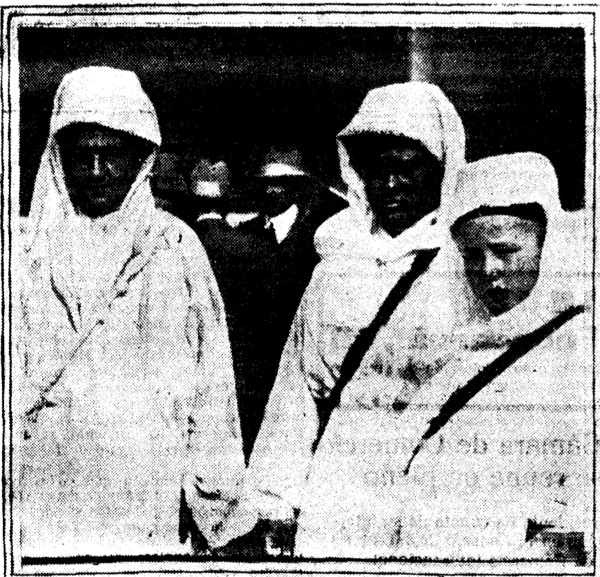
Los tres hijos del sultán de Marruecos, Muley Yuseff, cuyas bodas se han celebrado a la vez con gran pompa en Marrakesh