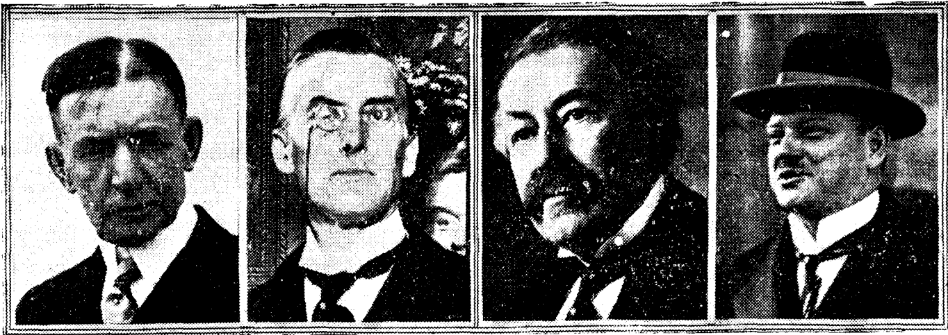
De izquierda a derecha: Dawes, Chamberlain, Briand y Stressemann