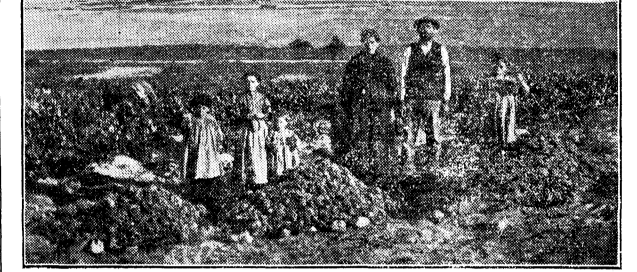
Primera parcela Sin abono. Segunda parcela 450 kilogramos de superfosfato...